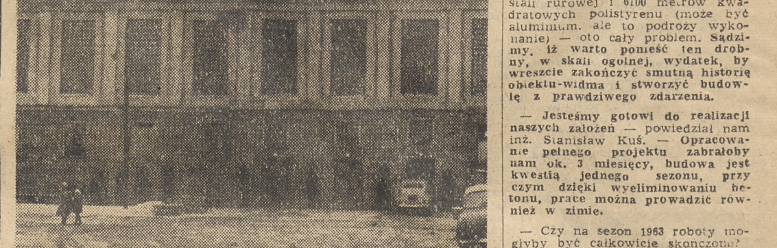
Czy Torwar pokryty będzie dachem?