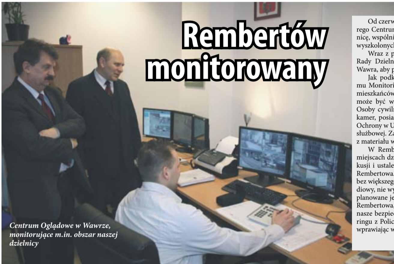
Centrum Oglądowe w Wawrze, monitorujące m.in. obszar naszej dzielnicy