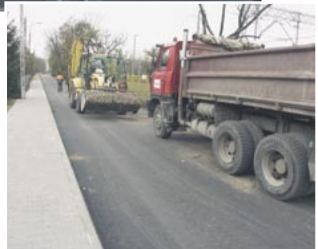
Ulica Bellony na Nowym Rembertowie