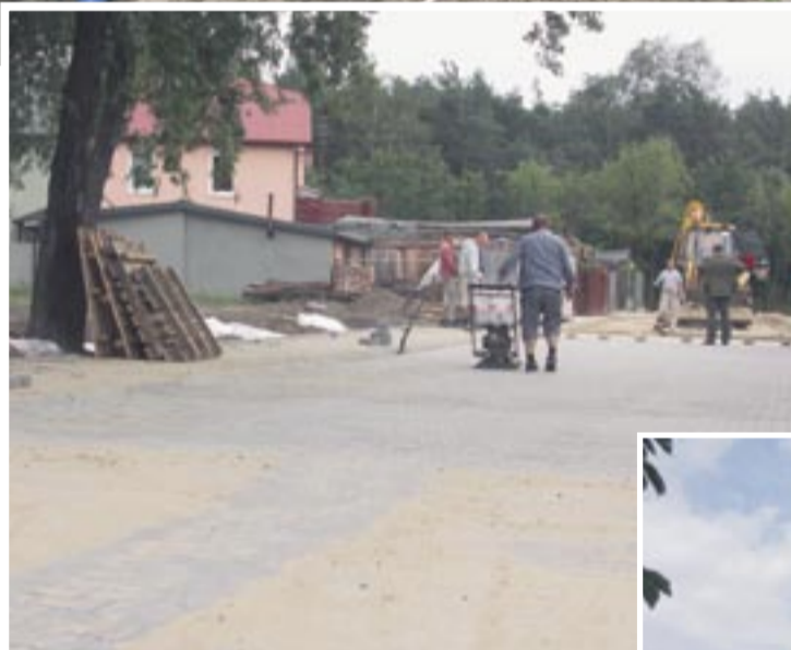
Ulica Bocheńskiego na Nowym Rembertowie

Zespół Szkół nr 76 przy ulicy Dwóch Miecz 5 Dobudowa sanitariatów oraz windy z przystosowaniem dla uczniów niepełnosprawnych.