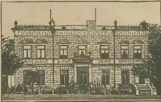
Dom własny Banku Spółdzielczego.