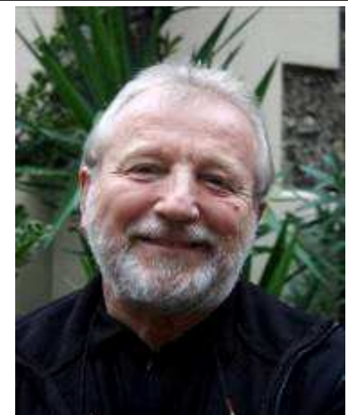
Verba volant, scripta manent