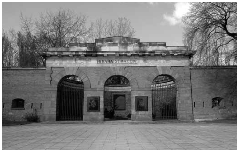
6. Brama Straceń z wmurowanymi tablicami upamiętniającymi pomordowanych w Cytadeli Warszawskiej