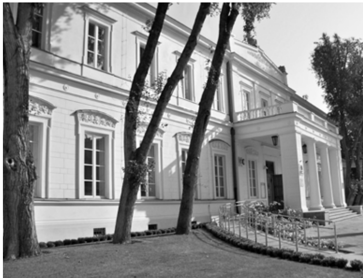
4. Budynek Mazowieckiego Centrum Kultury i Sztuki po renowacji

Mazowieckie Centrum Kultury i Sztuki (MCKiS) dzięki środkom z Unii stało się miejscem dostępnym również dla osób niepełnosprawnych. Na ten cel w ramach projektu pn.: „Zwiększenie dostępności do kultury poprzez renowację i modernizację zabytkowego budynku Mazowieckiego Centrum Kultury i Sztuki – stworzenie Centrum Aktywności Kulturalnej Osób Niepełnosprawnych” z UE przekazanych zostało ponad 1,5 mln zł. Jednym z udogodnień, które powstało w ramach projektu jest zewnętrzna winda. Poza tym po wyeliminowaniu architektonicznych barier na piętrze budynku – m.in. Galerii ELEKTOR, został stworzony program promocji twórczości osób niepełnosprawnych. W ramach tego programu instytucja będzie przynajmniej raz na kwartał organizowała imprezę artystyczną poświęconą twórczości osób niepełnosprawnych z obszaru Mazowsza. Została również wykonana renowacja zabytkowej elewacji i rekultywacja zieleni wokół obiektu.