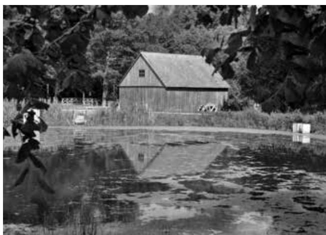
9. Młyn z Zajączkowa

Projekt pn.: „Zdarzyło się kiedyś nad wodą – Trasa turystyczna w radomskim skansenie” pozwolił wzbogacić radomski skansen o kolejne obiekty: dwa nowe oraz osiem zabytkowych. Został wybudowany nowy amfiteatr z zapleczem wystawienniczo-konferencyjnym oraz pracownia konserwacji zabytków z zapleczem. W amfiteatrze z zadaszoną sceną i widownią na 322 miejsc siedzących, odbywać się będą imprezy kulturalno-turystyczne. W budynku mieścić się będą m.in. sala wystawienniczo-konferencyjna oraz garderoby dla artystów. Drugi nowy obiekt – pracownia konserwacji stanowić będzie zaplecze techniczne dla konserwowanych i translokowanych zabytków. W budynku umiejscowiono pracownię stolarską, pracownię konserwatorską, magazyn zbiorów, garaże, warsztat oraz inne pomieszczenia pomocnicze i socjalne. Obiekt wyposażony został w windę towarową do obsługi magazynu zbiorów na poddaszu. Na nowej trasie turystycznej podziwiać można osiem zabytkowych obiektów m.in. zagrodę okólnik z Solca składającą się z czterech budynków – dwóch stodół ze spichlerzami, oboro-stajni oraz zadaszonej bramy wjazdowej, a także chałupę z Solca. W skansenie znalazł się także trak z Molend, a także dwa młyny – z Zofiówki napędzany turbiną oraz Zajączkowa na koło wodne. Projekt w radomskim skansenie wpłynie