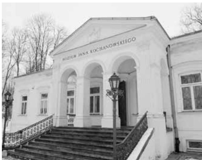
5. Muzeum Jana Kochanowskiego (oddział Muzeum im. Jacka Malczewskiego w Radomiu)

Celem projektu jest zwiększenie atrakcyjności turystycznej i nadanie większego znaczenia miejscu urodzenia Jana Kochanowskiego, a także innych terenów powiatu, cennych ze względu na walory naturalne i kulturowe. Projekt zakłada m.in. odbudowę istniejących stawów oraz utworzenie na terenie zespołu przyrodniczo-historycznego „Sycyna” terenowej ścieżki edukacji ekologicznej, wyposażenie jej w małą architekturę turystyczną oraz wyznaczenie wielofunkcyjnego szlaku turystycznego obejmującego tereny doliny Scynki i Doliny Zwolenki znajdujące się na obszarze Natura 2000.