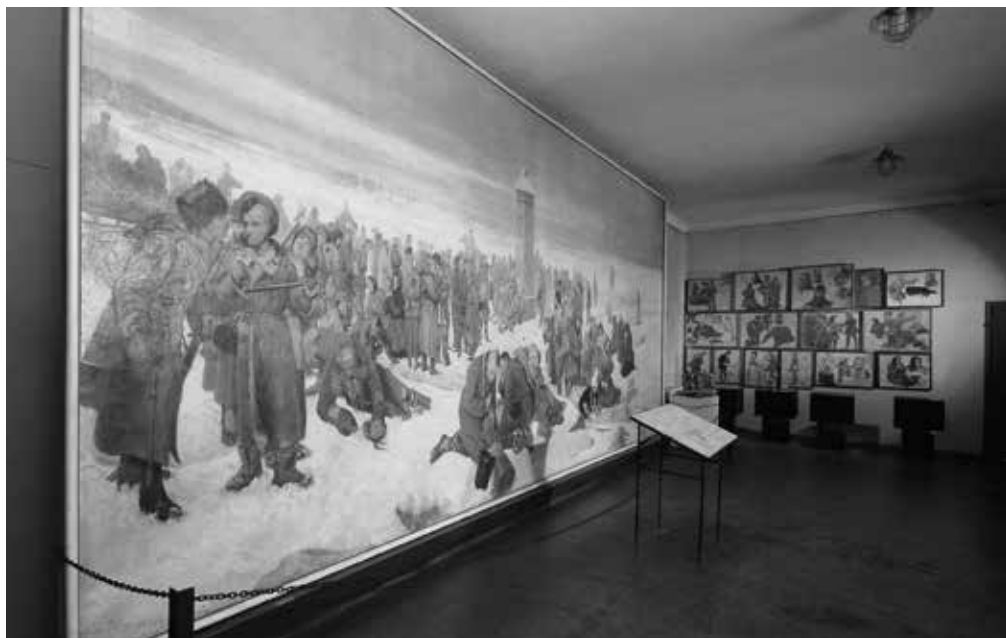
10. Fragment ekspozycji w Muzeum X Pawilonu; galeria malarstwa Aleksandra Sochaczewskiego

Muzeum X Pawilonu Cytadeli Warszawskiej zainaugurowało swoją działalność w stulecie wybuchu powstania styczniowego 22 stycznia 1963 r. We wschodnim skrzydle budynku otwarto wówczas pierwszą ekspozycję poświęconą powstaniu styczniowemu i I Proletariatowi. Otwarciu nadano bardzo uroczysty, wręcz propagandowy charakter z udziałem najwyższych władz państwowych i partyjnych. Jednocześnie trwały prace rekonstrukcyjne w pozostałej części budynku, przywracające mu jego dawny, więzienny wygląd. Po ich zakończeniu, 18 września 1969 r. otworzono tu ekspozycję stałą 79 .