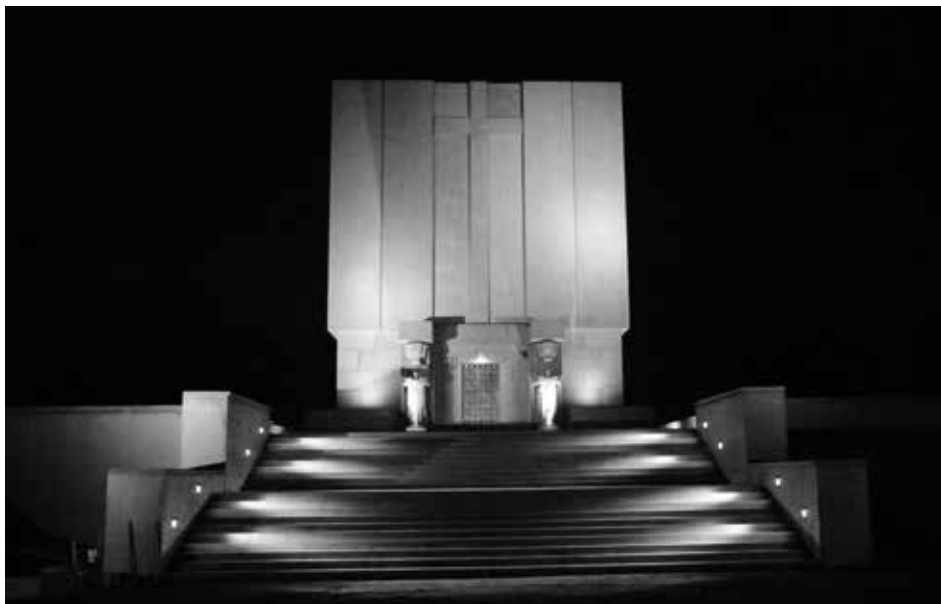
5. Pomnik Mauzoleum nocą

Realizacja projektu pn.: „Ponarwie. Konserwacja i rewitalizacja fortu ziemnego i pomnika-mauzoleum poległych w bitwie pod Ostrołęką 26 maja 1831 roku” uchroniła fort ziemny i pomnik-mauzoleum przed dalszą dewastacją. Dzięki wsparciu z Unii Europejskiej możliwe było przeprowadzenie prac konserwatorskich, w wyniku których pomnik-mauzoleum został zaadaptowany na potrzeby Muzeum Powstania Listopadowego. Pomnik Mauzoleum stanowi jeden z nielicznych zachowanych przykładów kubaturowych budynków z okresu dwudziestolecia międzywojennego upamiętniających poległych w bitwach 1831 roku. Zwiedzający mogą podziwiać przygotowane ekspozycje, m.in.: „Panorama bitwy pod Ostrołęką 26 maja 1831 roku i dzieje kampanii 1831 roku. Wirtualizacja przestrzeni historycznej pola bitwy”, „Obchody setnej rocznicy bitwy pod Ostrołęką w kontekście obchodów ogólnokrajowych upamiętniających wybuch powstania listopadowego i bitwy kampanii 1831 roku”. W ramach projektu uporządkowano także zieleń na terenie fortu, oczyszczono fosę oraz zrekonstruowano profile i nasypy wału ziemnego z bocznymi tarasami pomnika.