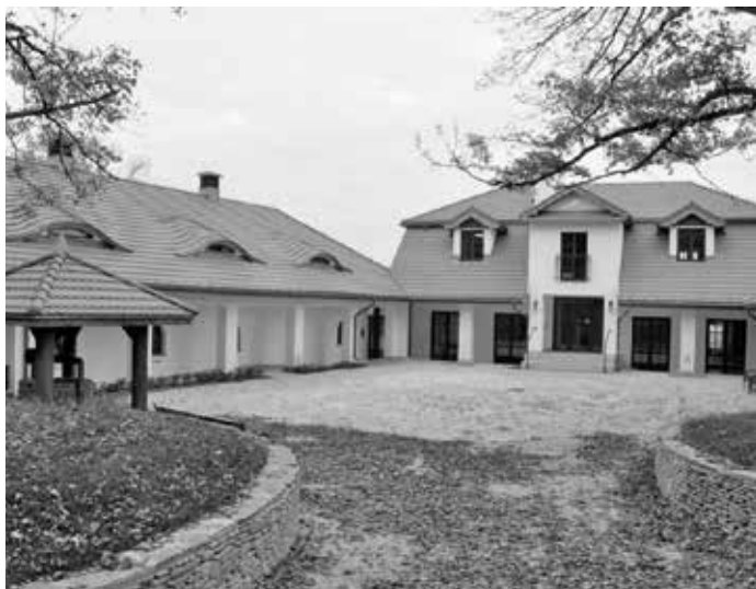
7. Widok na Folwark