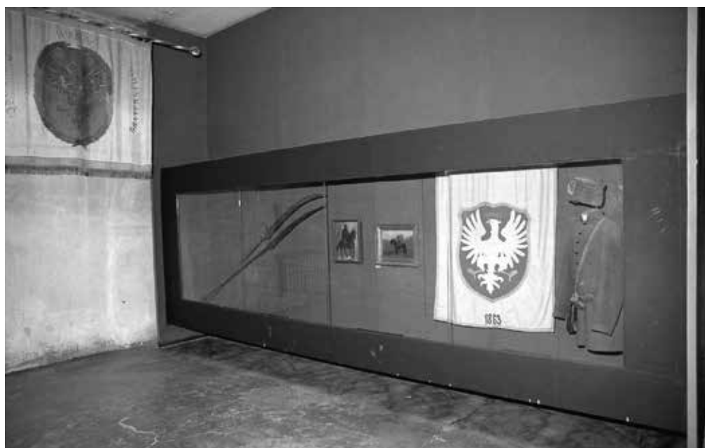
7. Muzeum X Pawilonu Cytadeli Warszawskiej Oddział Muzeum Niepodległości