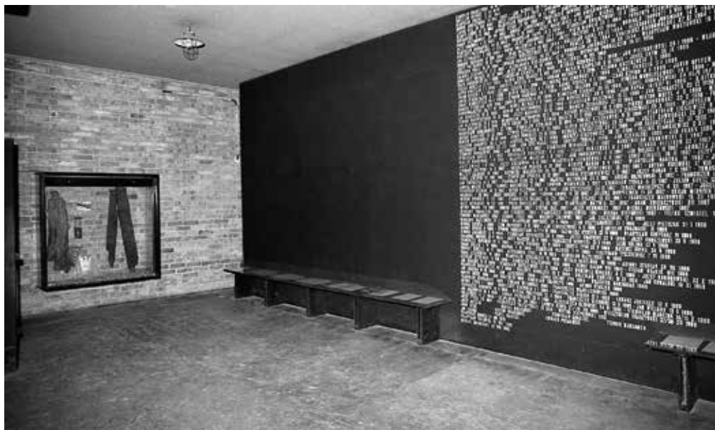
3. Tablica straconych na stokach Cytadeli Warszawskiej umieszczona w tzw. „korytarzu śmierci”