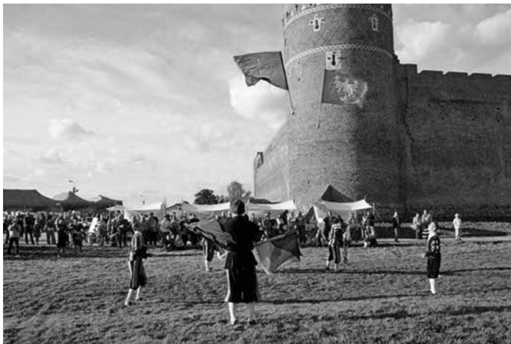
1. Spotkania z historią przed Zamkiem w Ciechanowie