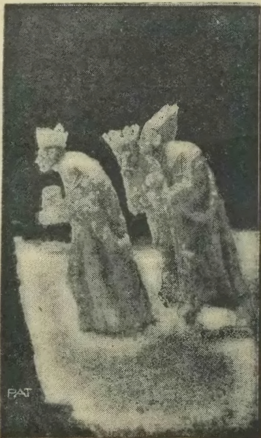
Kuracjusze w Krynicy zrobili w parku zdrojowym piękne figury Trzech Królów ze śniegu. Niech kto jeszcze spróbuje.