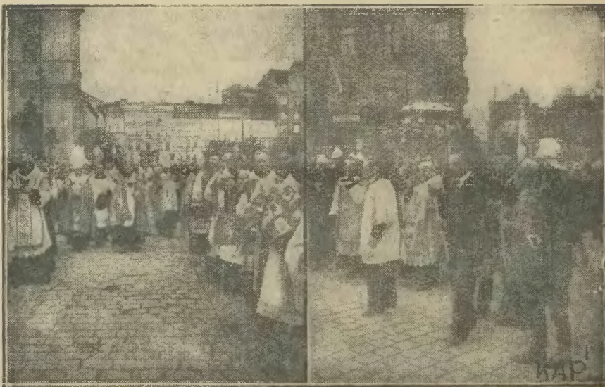
Procesja ulicami Lwowa z relikwiami bł. Jana z Dukli.