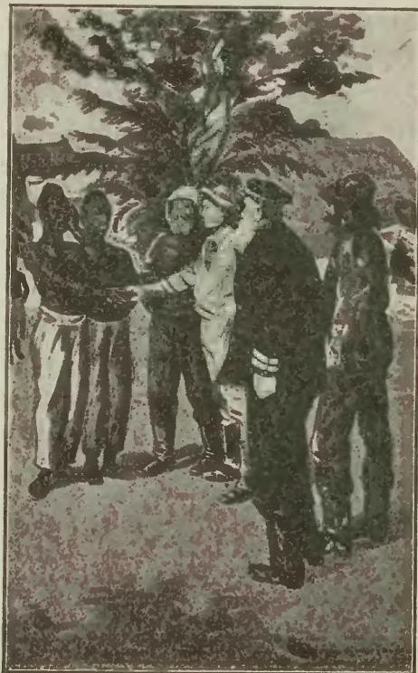
Pożegnanie z Kanakami.

kich ludzi, którzy w każdym człowieku widzą brata kochanego. Niejeden z przykrością myślał, że wracać musi do Anglii, lub Niemiec, gdzie go nikt życzliwy nie czeka, a większa część ludzi myśli o zdobyciu nie jego przyjaźni, lecz jego pieniędzy... Skąd będzie musiał uciekać z chwilą, gdy zostaną opróżnione jego kieszenie... Jakóbi Janek chociaż z przykrością rozstali się z „braćmi od serca“ jednak oni całą duszą wrywali się do kraju, do swoich.