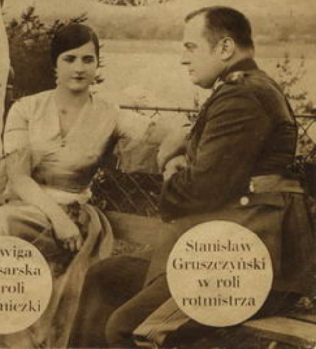
Jadwiga Smosarska w roli księżniczki