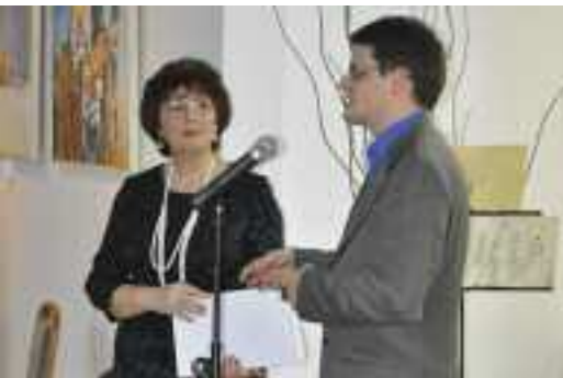
fol. Archiwum Biblioteki