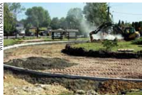
PRACE NA ZAJEJDNI