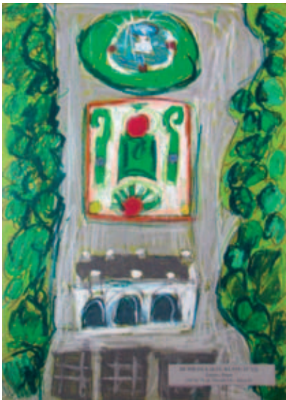
Łukasz Stopa, lat 10 – III NAGRODA