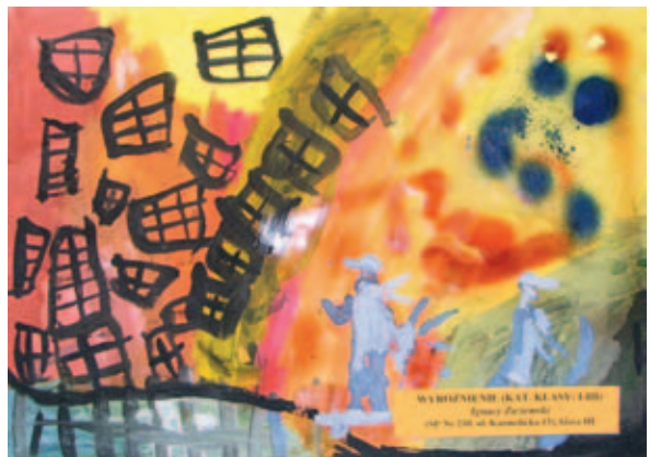
Ignacy Zaziemski, lat 9 – WYRÓŻNIENIE