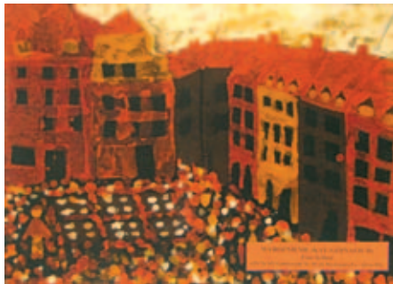
Eva Ścibior, lat 15 – WYRÓŻNIENIE