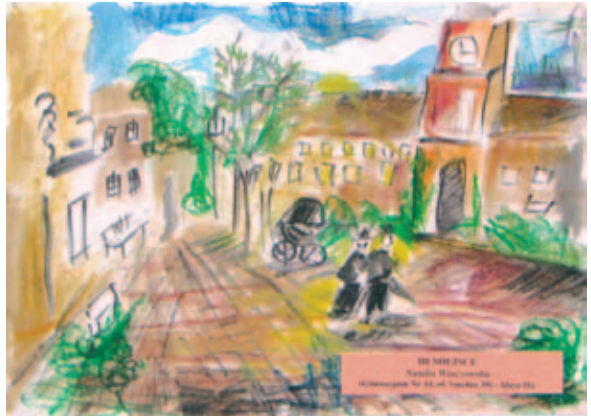
Natalia Winczowska, lat 14 – III NAGRODA