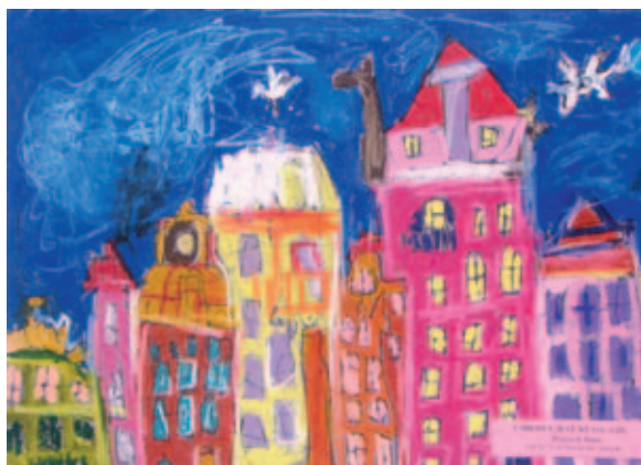
Wojciech Stopa, lat 7 – INAGRODA