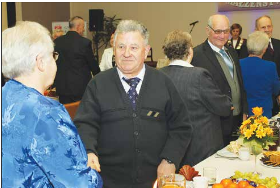
Małżonkowie wzajemnie sobie dziękują za wspólnie przeżyte pięćdziesiąt lat