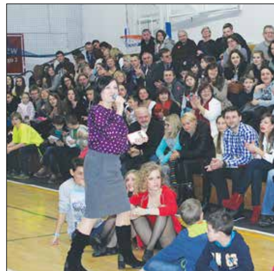
Licytację prowadzi znana