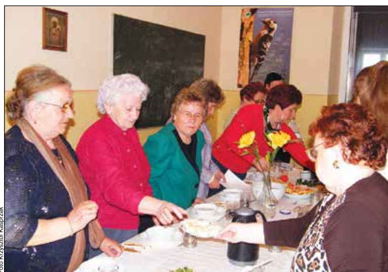
Spotkanie wielkanocne w klubie seniora w Karczewie (21.04.2009)

Uroczystość jubileuszową uświetnił koncertem zespół Stowarzyszenia Pasjonatów Muzyki „Trzy Czwarte”.(KK)