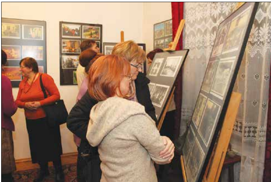
Z uwagą oglądano zaprezentowane na wystawie zdjęcia