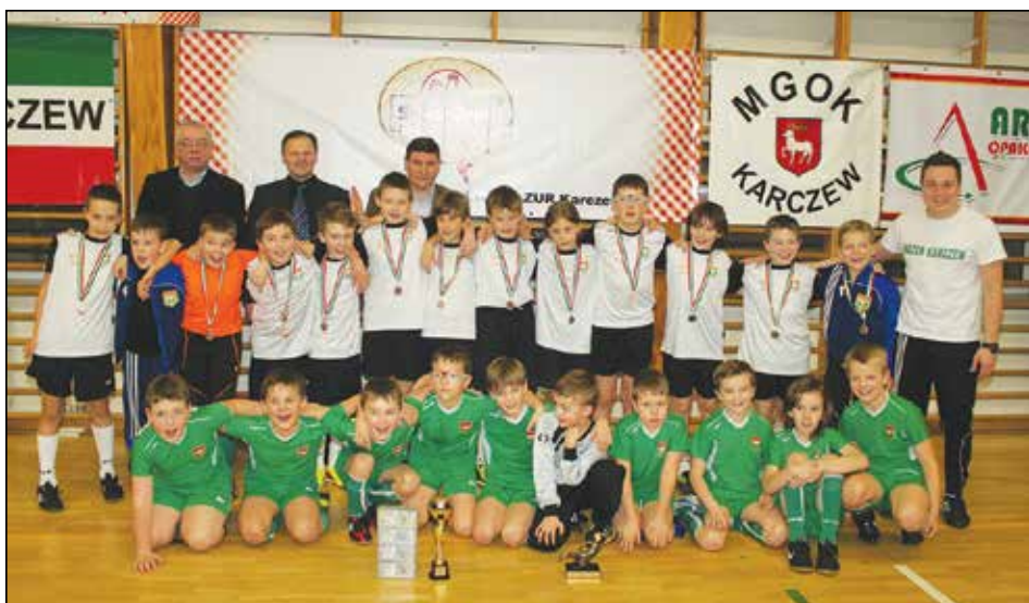
Obie drużyny reprezentujące Karczew na turnieju SuperDrob Cup 2014

Jedną z firm sponsorujących w Karczewie sport jest SuperDrob. Ostatnio, 9 lutego bieżącego roku, zakład ten współorganizował halowy turniej piłkarski dla chłopców w kategorii U-11 i młodzi SuperDrob Cup 2014. W turnieju tym Karczew reprezentowały dwie drużyny, które zajęły czwarte i piąte miejsce.