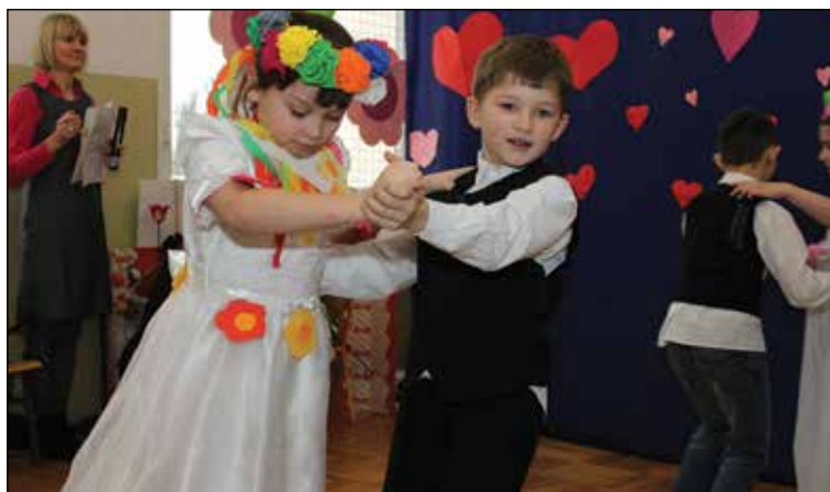
Krakowiak zatańczony został z wielką fantazją