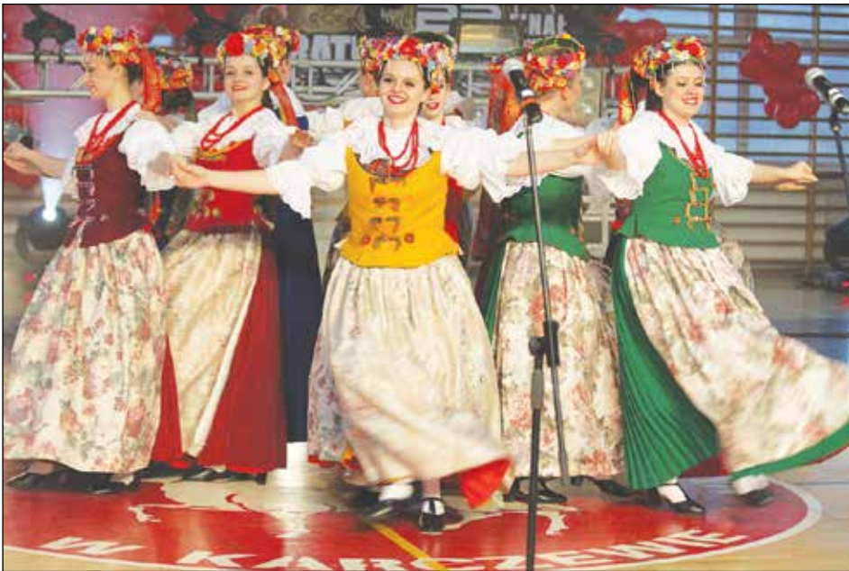
Tańczy Zespół Pieśni i Tańca Politechniki Warszawskiej