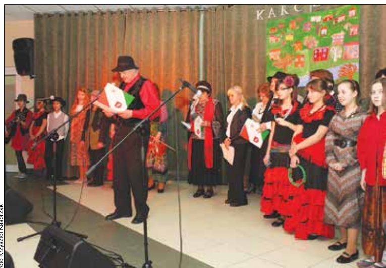
Scena z przedstawienia teatralnego „KARCZEW” (6.02.2011)