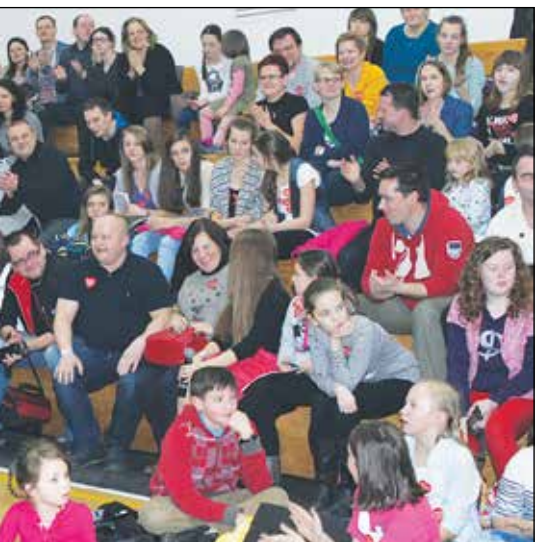
aktorka Hanna Śleszyńska