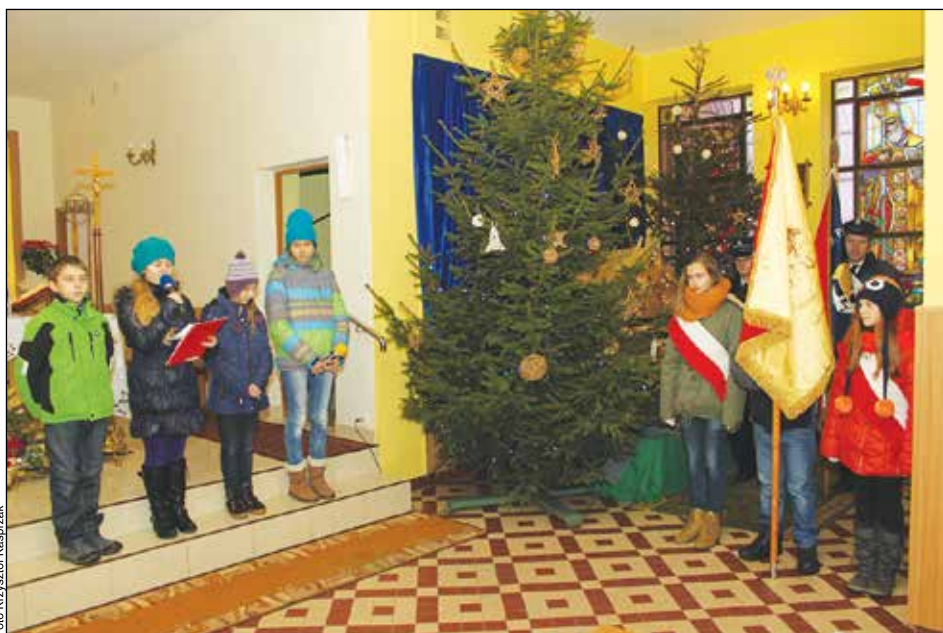
Na zdjęciu poczty sztandarowe z Otwocka Wielkiego - Zespołu Szkolno Przedszkolnego i OSP