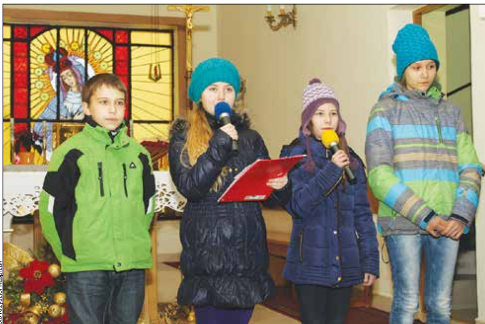
Występują uczniowie Zespołu Szkolno Przedszkolnego w Otwocku Wielkim

Druga część uroczystości odbyła się przy mogiłach powstańców w Osinach, gdzie delegacje uroczystie złożyły wiązanki kwiatów. (red)