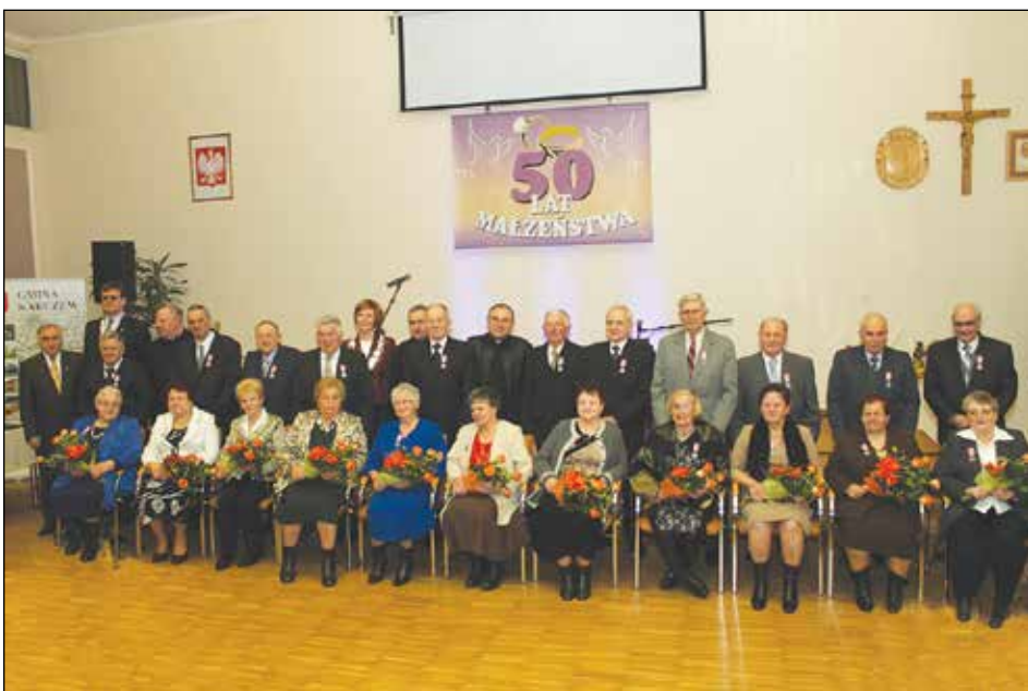
Pamiątkowe zdjęcie wszystkich jubilatów