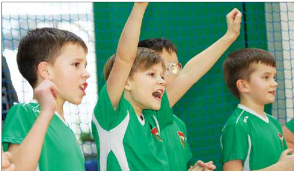
Tak młodzi piłkarze Mazura kibicowali swoim kolegom