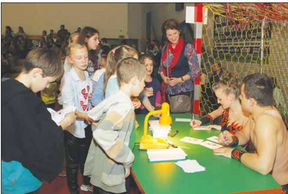
Chwila dla wielbicieli

22 Finał Wielkiej Orkiestry Świątecznej Pomocy „Ratunek”, a pieniądze zebrane na zakup nowego sprzętu dla dziecięcej m... dycznej seniorów.