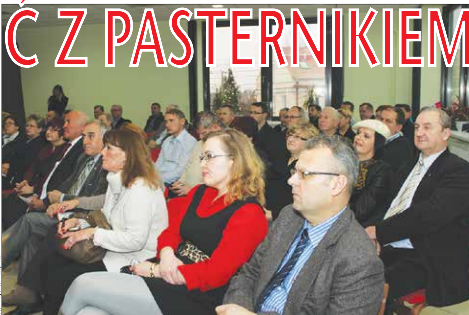
W spotkaniu wzięło udział wielu gości - także spoza Gminy Karczew

O przyszłości Wspólnoty Pastwiskowej zdecydują ostatecznie radni, ale jak wykazała przeprowadzona debata, decyzja ta nie będzie łatwa. (red)