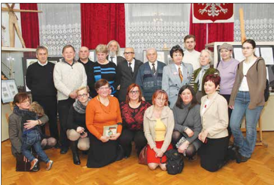
Ta grupka osób to tylko cząstka kadry instruktorskiej działającej, jeszcze kilka lat temu, na terenie Gminy Karczew