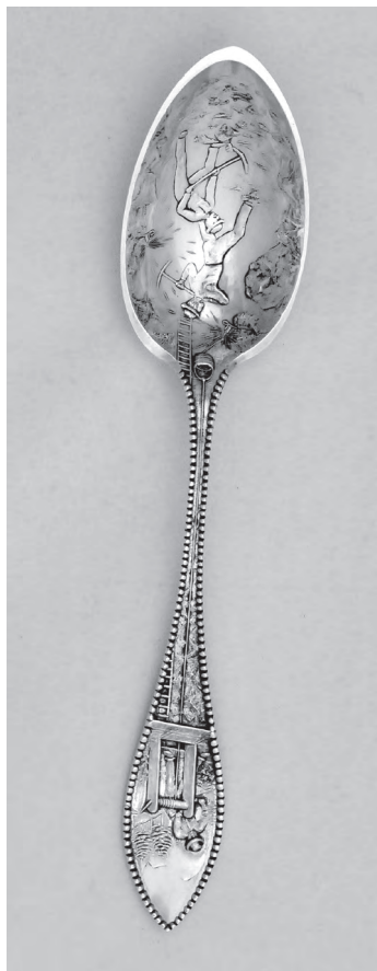
Łyżeczka pamiątkowa z kopalni rud w Butte Mont w Stanach Zjednoczonych

ło się najwięcej podarunków z dedykacjami, jakby naród ten najczęściej honorował Paderewskiego 8 .