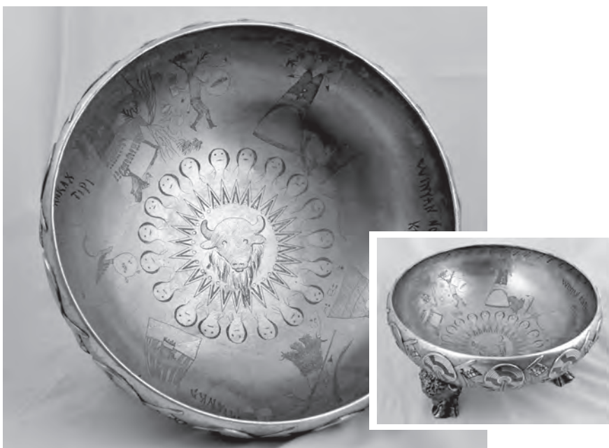
Dekoracje o etnicznym charakterze, zaczerpnięte z obrzędowości indiańskiej rytowane i niellowane we wnętrzu wazy