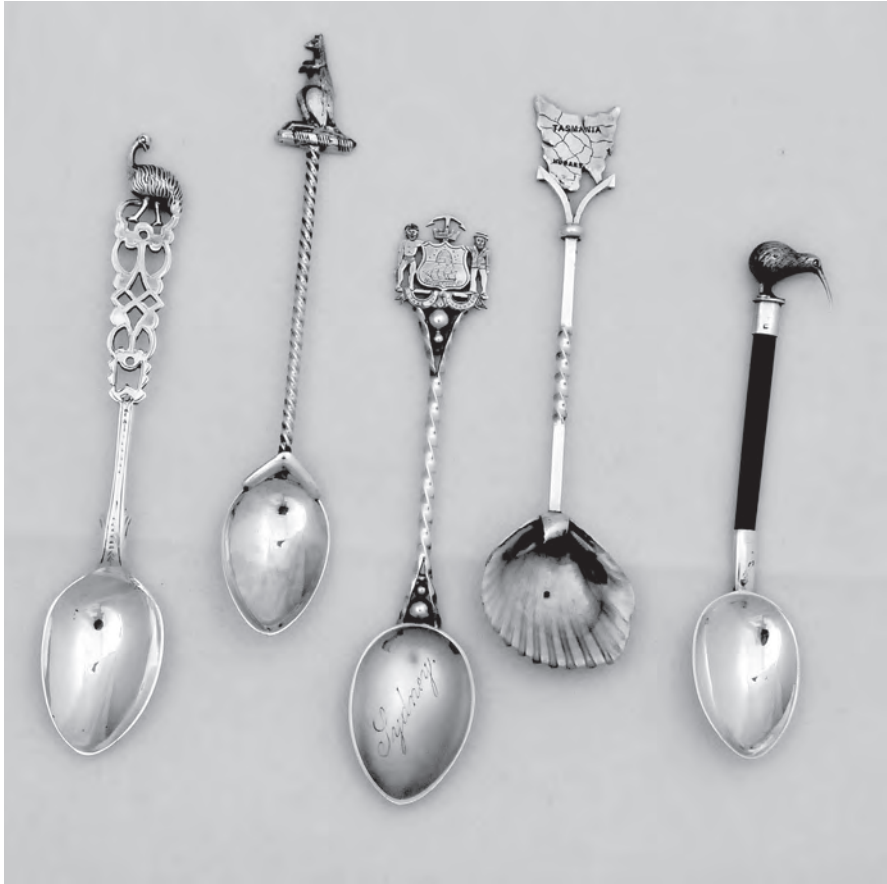
Łyżeczki z podróży po Australii i Nowej Zelandii z miejscowymi symbolami: strusiem, kangurem, herbem Sydney, mapą Tasmanii, i ptakiem kiwi

nefrytowe czarki. Jednak to właśnie dzięki nim można odtworzyć pewne zdarzenia z życia Paderewskiego i tym samym ustalić okoliczności ich powstania. Wiele z nich zostało podarowanych Paderewskiemu w dowód uznania, sympatii czy z wyrazami wdzięczności. Zwykle przedmioty te związane są z faktami mniej znanymi biografom wirtuoza. Duża część z nich wiąże się z okresem, który Paderewski spędził w Stanach Zjednoczonych Ameryki. Wiadomo powszechnie, że wielbili go amerykańscy słuchacze. Bilety na koncerty były wykupowane do ostatniego, choć wybierano duże sale, by zmieścić wszystkich chętnych. To właśnie z tego kraju zachowa-