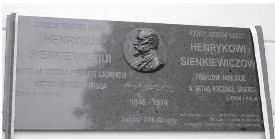
Tablica pamiątkowa ku czci Henryka Sienkiewicza.