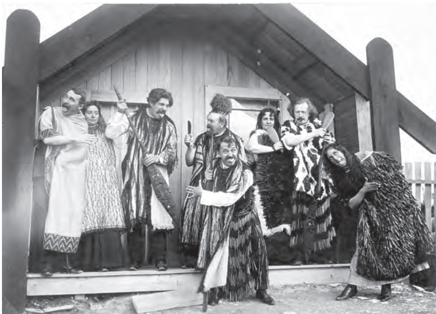
Ignacy Paderewski z żoną i organizatorami jego tournée po Australii i Nowej Zelandii w 1904 roku, ubrani w stroje regionalne, w maoryskiej wiosce