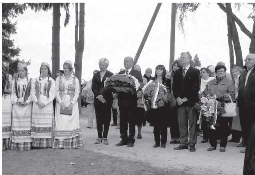
Składanie wieńców pod pomnikiem księcia Witolda. Od lewej przedstawiciele Sejnińskiego Towarzystwa Opieki nad Zabytkami, Fundacji „Pomoc Polakom na Wschodzie” oraz władz rejonu Radziwiliszki i gminy Szczedrobowo.