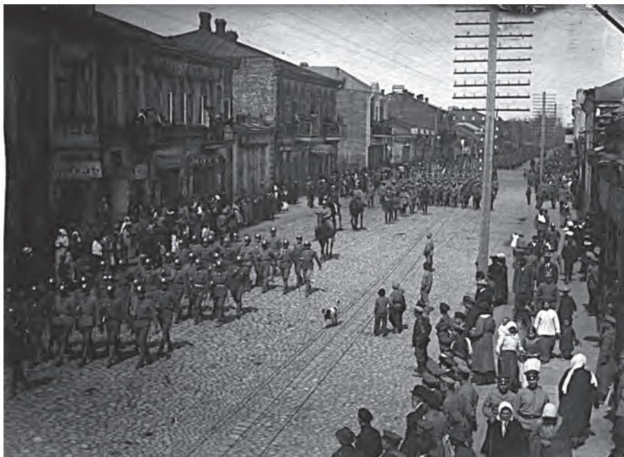
Uroczystości pogrzebowe płk. Bolesława Mościckiego w Mińsku Litewskim w 1918 roku, MN F 11670

Przypominał też słowa płk. Mościckiego świadczące o jego poczuciu żołnierskiego obowiązku i głębokim patriotyzmie: