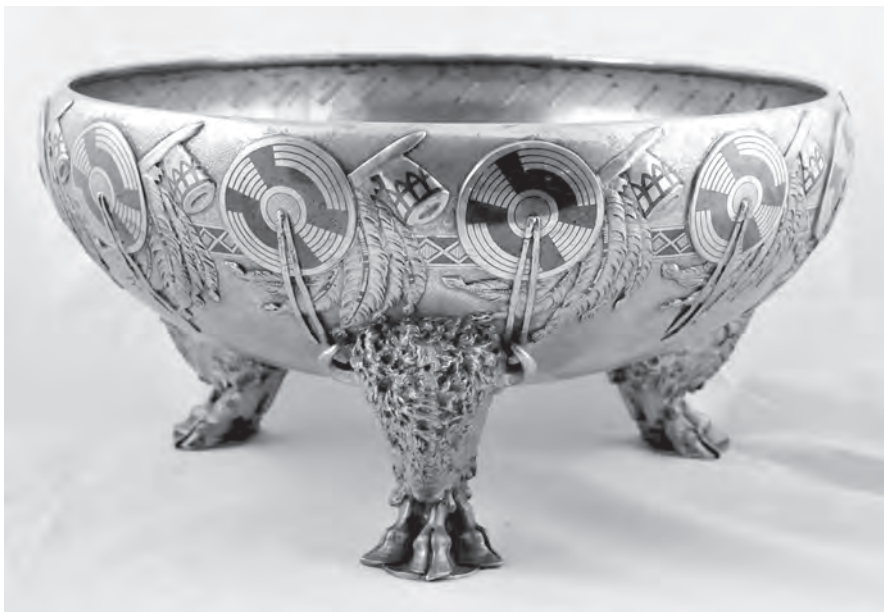
Waza wykonana przez Tiffany & Co. w Nowym Yorku w 1892 roku, z dedykacją od firmy Steinway