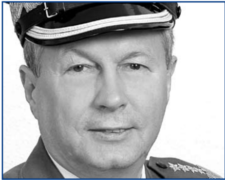
Gen. Franciszek Gągor

Szef Sztabu Generalnego Wojska Polskiego: polski dowódca wojskowy, oficer Wojsk Łądowych, specjalista w dziedzinie rozpozna-