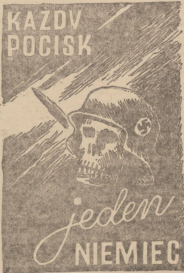
Afisz powstańczy nieznanego artysty

Tym stwierdzeniem oddajemy hołd ceniom wszystkim poległych żołnierską śmiercią i odważamy sprawiedliwość tym, którzy — uświadomiwszy już sobie beznadziejność dalszej walki i dalszego oporu — trwali dalej na straconych posterunkach. I kto wie, czy historia nasza tak bogata w charaktery i męstwo nie nazwie ich najpiękniejszym pokoleniem Polski walczącej.