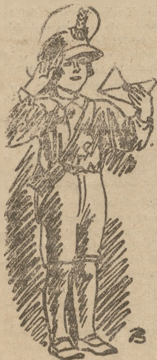
(Rys. E. B. Pawlarczyk)

Wybór, jakiego dokonaliśmy, był celowo przypadkowy i celowo wolny od oceny estetycznej. Pragniemy gorąco, by te wiersze powstańcze przyjęte zostały przez czytelników tak, jak wtedy, gdy pełniły swą wielką misję wśród barykad, wśród walących się domów, w dymie pożarów i w dumnym patosie śmierci za wolność.