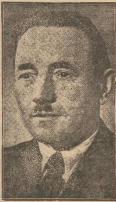
Prezydent K.R.N. B. Bierut

W dniu 20 listopada Prezydent KRN Bolesław Bierut udzielił znanemu publicyście, Ksaweremu Pruszyńskiemu następującego wywiadu: