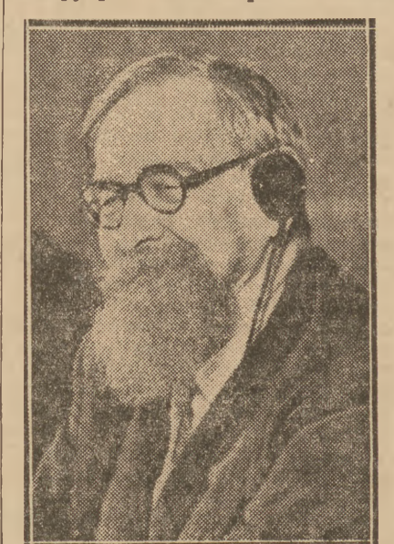
Prof. St. Grabski

Grabski, trzeźwy polityk i wnikliwy obserwator faktów historycznych, z rozumną obiektywnością ocenia zmiany naszych granic, uważając przedwojenny układ mniejszościowy na naszych rubieżach wschodnich jako jedno z poważnych źródeł słabości polityczno-państwowej, albowiem: „Nie ma powrotu do tego co było przed wrześniem 1939, ani do ówczesnego naszego terytorium państwowego, ani do ówczesnego składu etnograficznego Rzeczypospolitej Polskiej, ani do poprzedniego uwarstwienia społecznego, ani do przedwojennych programów partyjnych, ani do ideologii Wielkiej Polski czy Polski Mocarstwowej.”