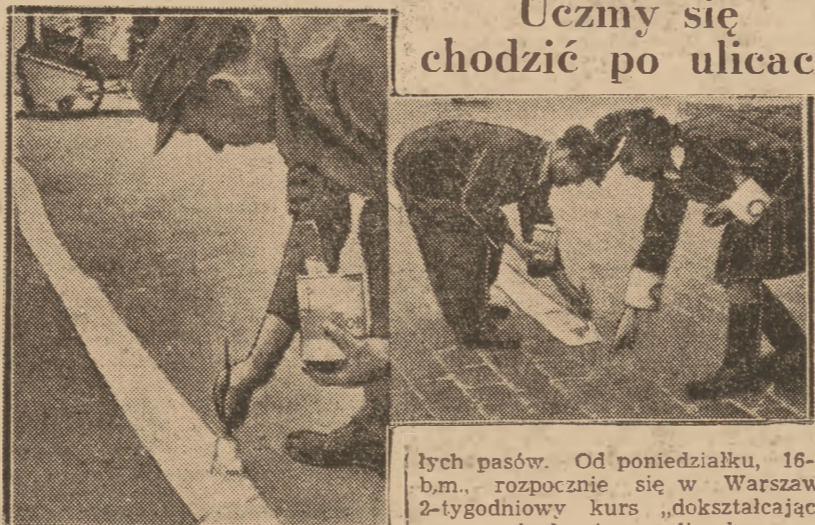
Na jeźdźniach, w miejscach skrzyżowania ulic, rozpoczęto malowanie białych pasów. Od poniedziałku, 16-go b.m., rozpocznie się w Warszawie 2-tygodniowy kurs „doksztalcający” chodzenia po ulicach.