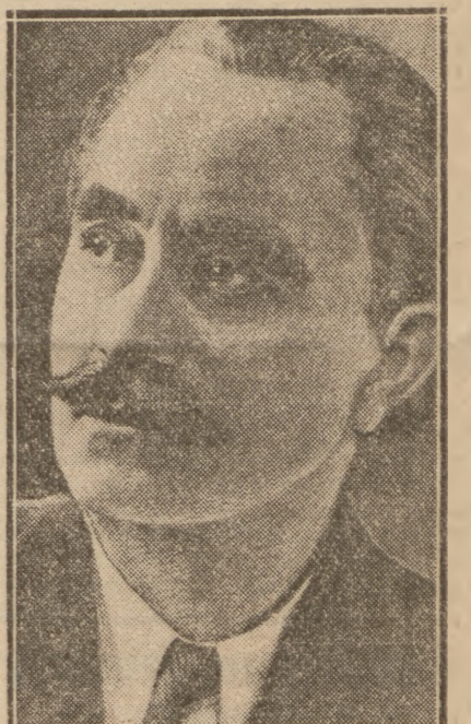
Georg Dymitrow przywódca Frontu Ojczyźnianego w Bułgarii.