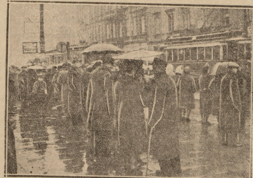
Tak wyglądał wczoraj fragment ulicy warszawskiej, w słotną niedzielę jesienną.

NOWY JORK (PAP). Prezes kongresu związków przemysłowych, CIO, Murray, w przedwyborczym przemówieniu radiowym wezwał amerykański świat pracy do głosowania w zbliżających się wyborach przeciwko reakcyjnemu, republikańskiemu kandydatom, ponieważ republikanie wnieśli w okresie ostatniej kadencji kongresu 40 projektów ustaw, skierowanych przeciwko światu pracy.