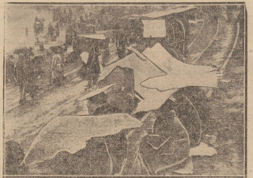
Wczoraj odbył się mecz Kraków — Warszawa o puchar Józefa Kaluży. Mecz, z którego sprawozdanie podajemy na str. 5-ej, ścignął, pomimo deszczu, wielu zwolenników sportu. Jak widać na naszej ilustracji, ratowali się przed deszczem osłoną z dyktów i papieru.