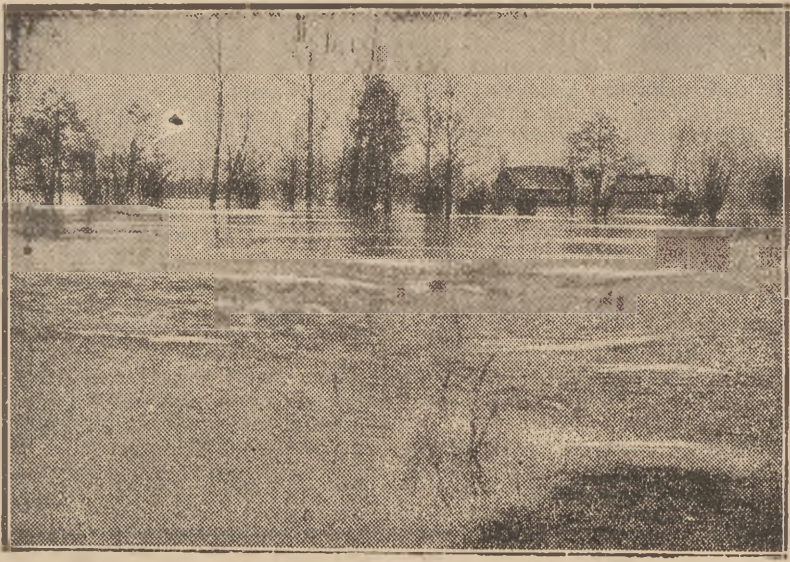
Wieża Głusk k. Ilowa, po przerwaniu wałów na Wiśle, znalazła się pod wodą. Ofiarom powodzi pośpieszili z pomocą saperzy, przewożąc ludność i inwentarz w bezpieczne miejsce. Teraz wieś wygląda jak wielkie jezioro. Po żyznych polach przelewała się masy żółtawej, mętnej wody.