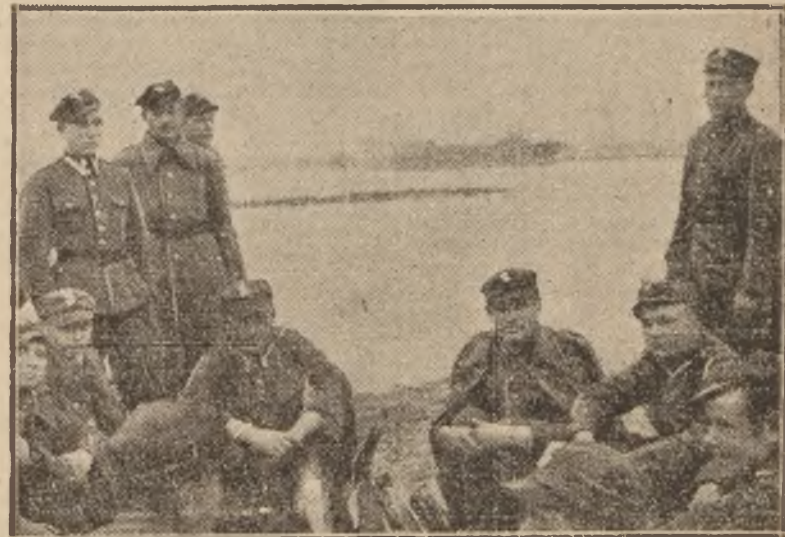
Pod wpływem ciepła stwardniałe od wioseł ręce znów staną się elastyczne i zdolne do dalszego wysiłku.