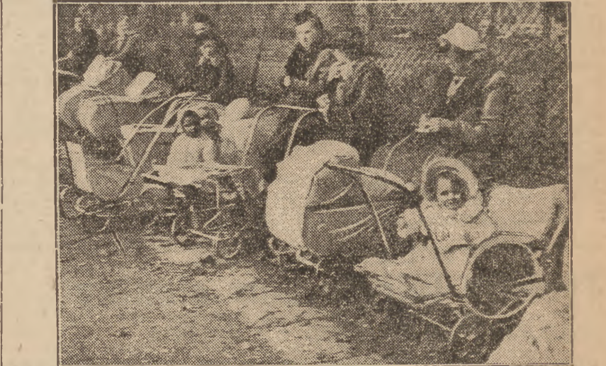
Zmotoryzowana dziecięca rewia wygrzewa się na słońcu.