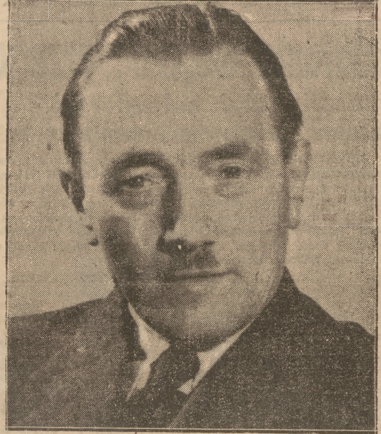
Dzisiaj, 22-go lipca, cała Polska skła da życzenia imieninowe, Dostojnemu Solenizantowi, Prezydentowi Rzeczypospolitej, Życiorys Prezydenta Bieruta podajemy wewnątrz numeru.