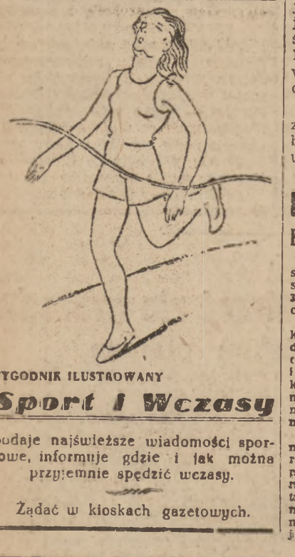
TYGODNIK ILUSTROWANY Sport i Wczasy