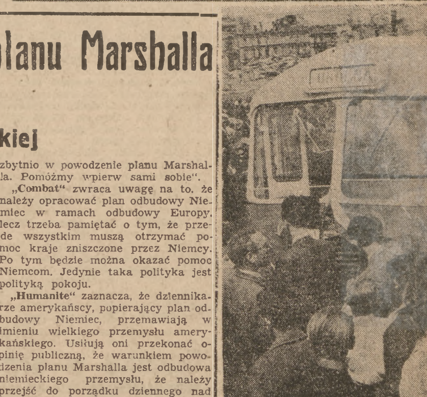
Powyżej — Uroczyste przekazanie na Pl. Zwycięstwa 30 traktorów typu „Urus”, wyprodukowanych całkowicie w Państwowych Zakładach Inżynierii. Traktory będą wysłane na Żalawy pod Gdańskiem, gdzie będą zaorzywały w góry.