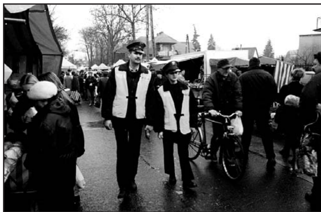
Patrol na targowisku miejskim