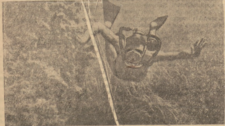
Człowiek-zaba w akcji.