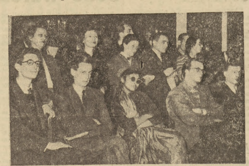
Wszyscy zastępli w milczeniu. Przewodniczący jury podniósł do oczu listę. Za chwilę padnie pierwsze nazwisko...