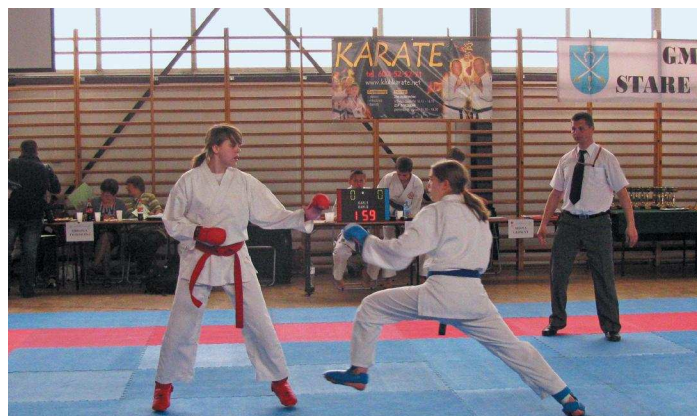
Walka na macie