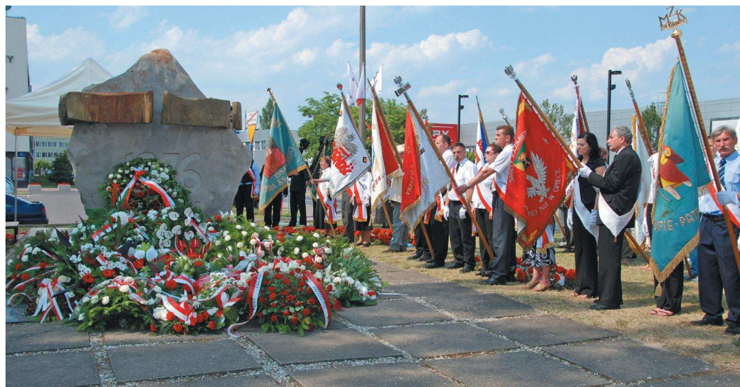
Pomnik Czerwca `76 autorstwa Leszka Nadstawnego

25 czerwca o godz. 19.00 na scenie letniej w Parku Czechowickim przy ul. Spisaka zaplanowano koncert młodzieżowych zespołów pt. „Pamiętamy...” w ramach obchodów 35. rocznicy wydarzeń Czer-