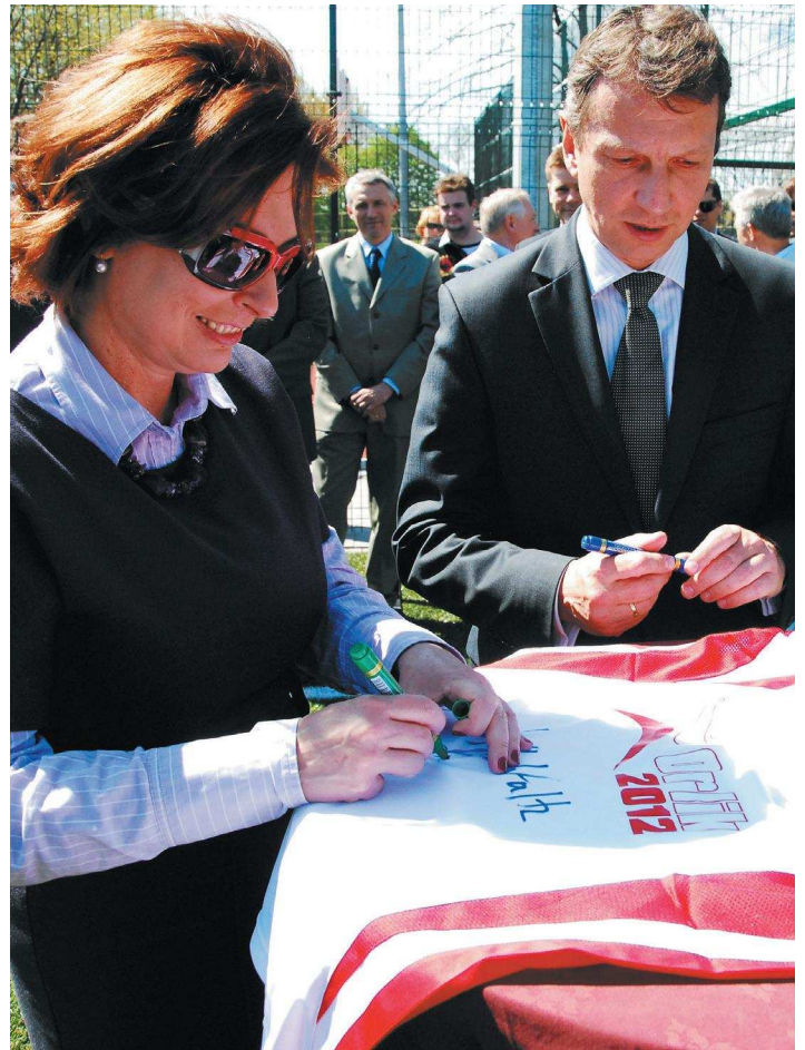
Małgorzata Kidawa-Błońska i Andrzej Halicki

W uroczystości udział wzięło wielu znakomitych gości z Prezydent m. st. Warszawy Hanną Gronkiewicz-Waltz na czele. Parlament reprezentowali: Małgorzata Kidawa-Błońska, Andrzej Halicki oraz Roman Kosecki, który w latach 80. stawił w Ursusie pierwsze piłkarskie kroki. Liczną reprezentację przedstawicieli władz dopełnili: Wicemarszałek Województwa Mazowieckiego