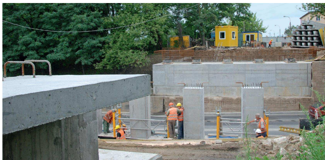
Z dnia na dzień widać postęp robót

Na placu budowy czekają już belki betonowe, na których zostanie ułożony pomost. Możemy spodziewać się, że dalsze prace przebiegną również bez zakłóceń.