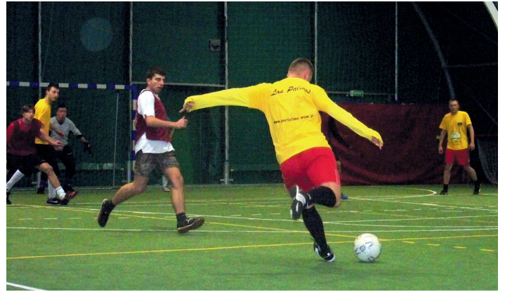
Drużyna Las Palmas w ofensywie

Legion Niedźwiadek. Półfinały okazały się wbrew oczekiwaniom bardzo jednostronnymi widowiskami. O ile zwycięstwa Black&White nad Las Palmas można było się spodziewać, ponieważ pierwszy mecz rozegrany pomiędzy nimi zakończył się wynikiem 11:2, to wynik pojedynku FC Siepaczy z Nietoperzami zaskoczył wszystkich zgromadzonych, zarówno kibiców, jak i samych uczestników meczu. Mniejszym zaskoczeniem był awans FC Siepaczy do finału, ale już rozmiar zwycięstwa okazał się prawdziwą sensacją. Ekipa Nietoperzy, która do niedawna występowała w naszych rozgrywkach pod nazwą Sparta, rokrocznie plasowała się na czołowych pozycjach w lidze nawet dwukrotnie z rzędu wygrywając, była zdecydowanym faworytem tego pojedynku, gdyż ich przeciwnik to solidna drużyna ze środka tabeli, balansująca pomiędzy pierwszą a drugą ligą. Tymczasem Nietoperze ulegli FC Siepaczom 0:10. W meczu o trzecie miejsce Nietoperze pokonały beniaminka pierwszej ligi Las Palmas 7:4. Finałowa gra to popis umiejętności indywidualnych i zespołowych Black&White. Przez cały mecz nie było ani jednego momentu, w którym ich zwycięstwo by-