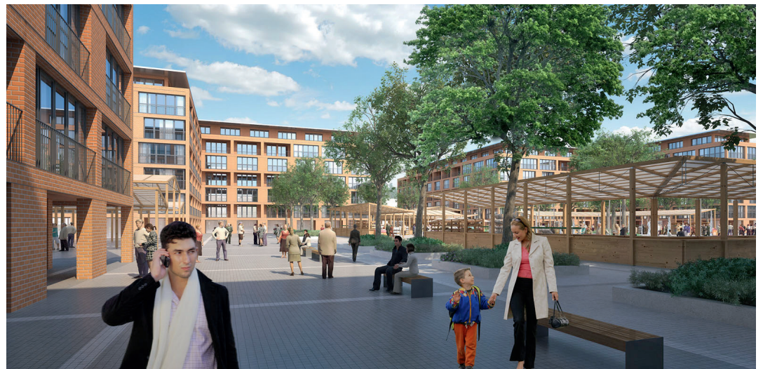
Wizualizacja Miasteczka Ursus

terenów pod niezbędne funkcje miejskie. Mowa tu o zarezerwowaniu miejsca na: usługi, placówki edukacyjne oraz tereny zielone i miejsca rekreacji. Planuje się, że po uchwaleniu miejscowego planu zagospodarowania przestrzennego na tym terenie w ciągu kilkun-