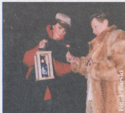
Moment zapalenia pierwszej świeczki.

8 grudnia, o godz. 17 na moment zgasło światło przed Urzędem Dzielnicy Ursus m. st. Warszawy. Za chwilę jednak, choinka stojąca przy budynku urzędu rozbłysła kolorowymi światełkami.