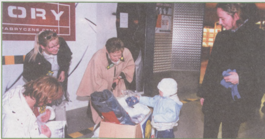
Podczas zbiórki w „Factory”.