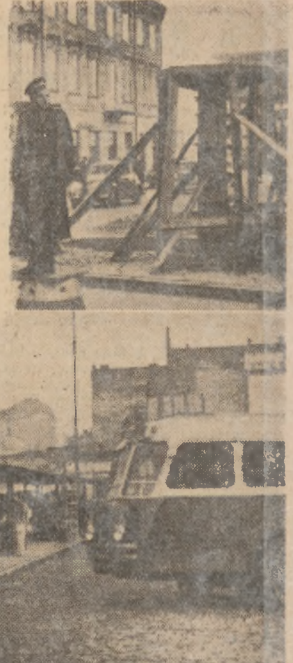
Również MKZ robia co mogą. Zdjęcie dolne przedstawia wykonany ostatnio daszek ochronny na przystanku autobusowym naprzeciwko Polonii, pod który w czasie deszczu mogą schronić wyciekający na przystanku pasażerowie.

Ruch w Warszawie coraz bardziej się usprawnia. Po Nowym Świecie, który pierwszy otrzymał sygnały świetlne, przyszła wreszcie kolej na skrzyżowanie Brackiej z Alejami. Wprawdzie stoi tu jeszcze milicjant (zdjęcie obok), lecz już za nim wyrasta wygodna budka, z której niedługo będzie można otwierać i zamykać ruch przekreśleniem kontaktu.