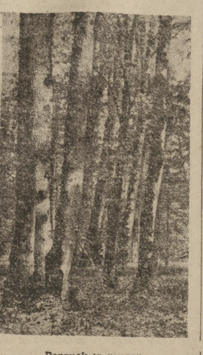
Poranek w puszczy

— Ja to wicie, tak jak doktor, który opuka człowieka i od razu powie na co który chory. Tylko spojrzę na drzewo i wiem czy zdrowe.