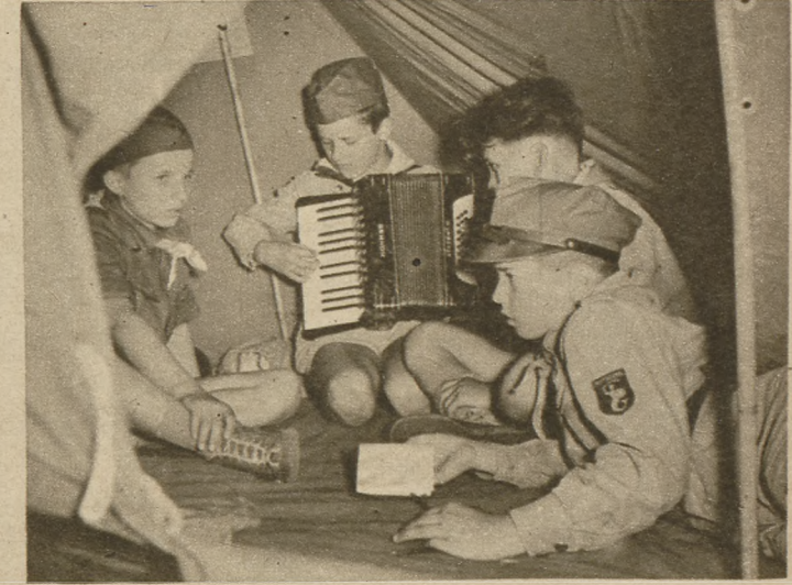
Już w sobotę po południu, a na pewno w niedzielę, nie znajdziecie w mieście ani jednego harcerza. Fejno ich za to w okolicznych lasach. Rozbić pierwszy raz w życiu prawdziwy namiot nie jest na pewno łatwo, ale „jak sobie poradzisz, tak się wyspisz”. A takiej zupy, jaką się samemu ugotuje, nie przyrządzi żadna mama. Na świątecznych biwakach harcerze uczą się wszystkiego — nawiązują łączność telefoniczną z sąsiednimi drużynami, ćwiczą podchody, śpiewają — uczą się samodzielnego życia.