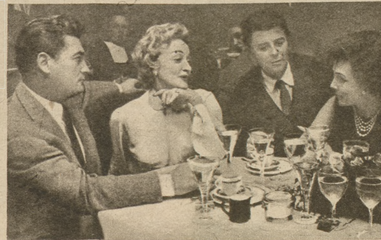
Rendez-vous gwiazd w nowojorskim hotelu „Waldorf Astoria"... Od lewej: Jean Marais, wiceminister Marięna Dietrich oraz Gerard Philipe.