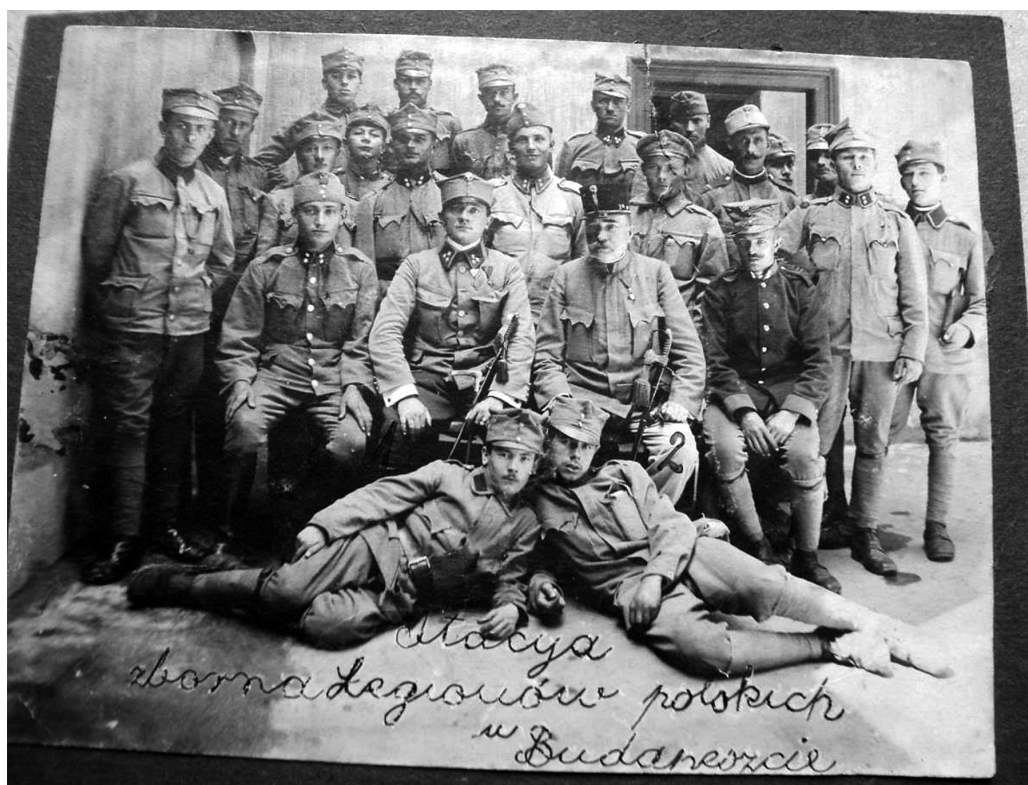
Legioniści przed budynkiem Stacji Zbornej LP w Budapeszcie w towarzystwie węgierskiego oficera