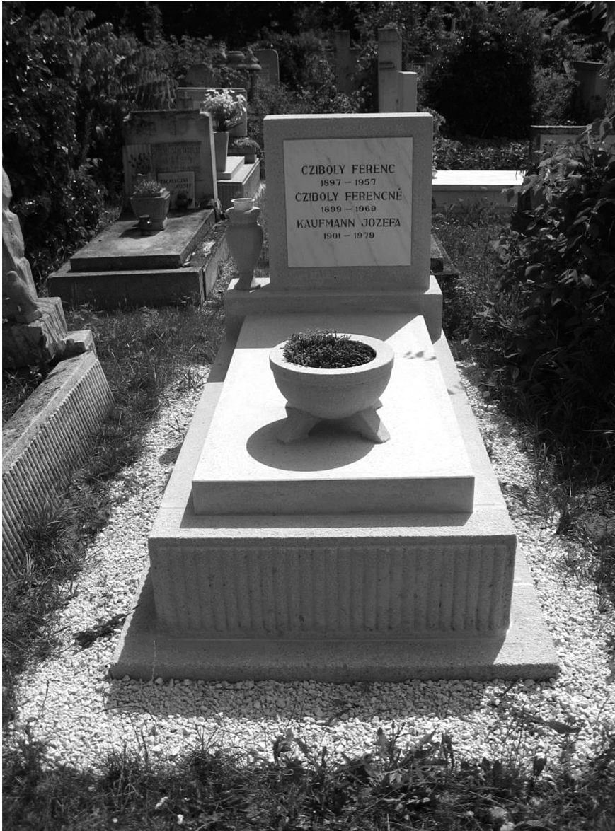
Nagrobek legionisty Ferenc'a Cziboly'a w Budapeszcie