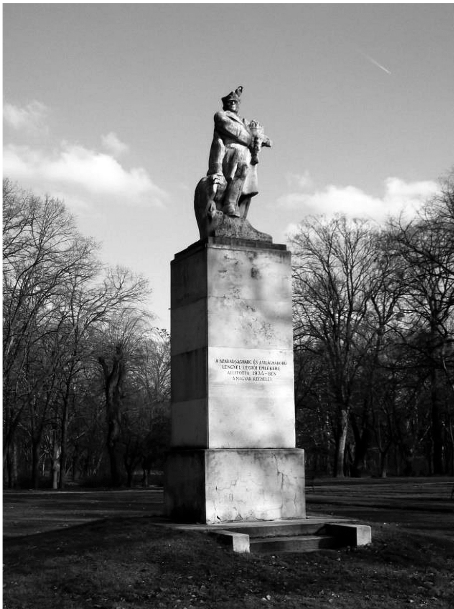
Pomnik legionistów w Budapeszcie