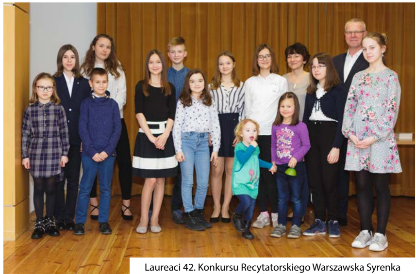
Laureaci 42. Konkursu Recytatorskiego Warszawska Syrenka

Życzenia zdrowych, spokojnych, pełnych rodzinnego ciepła i radości Świąt Wielkanocnych