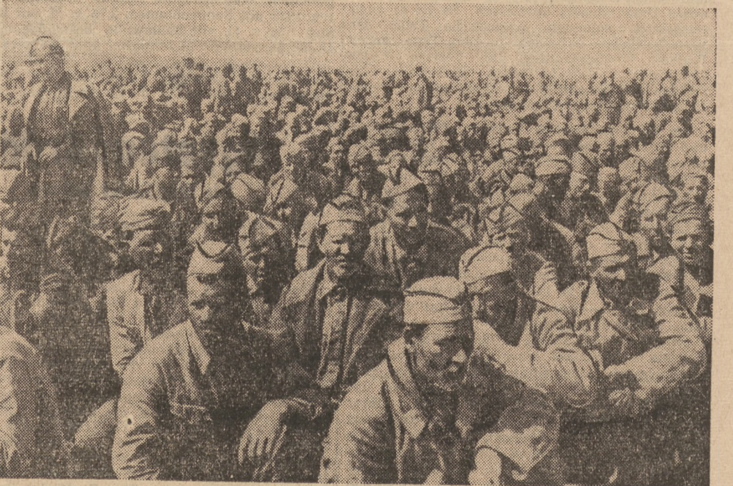
Ein Gefangenenerlager im großen Donbogen: Unter den Gefangenen sieht man viele alte Gesichter, ein Beweis dafür, daß die Sowjets hier bereits ältere Jahrgänge in den Kampf werfen mußten.