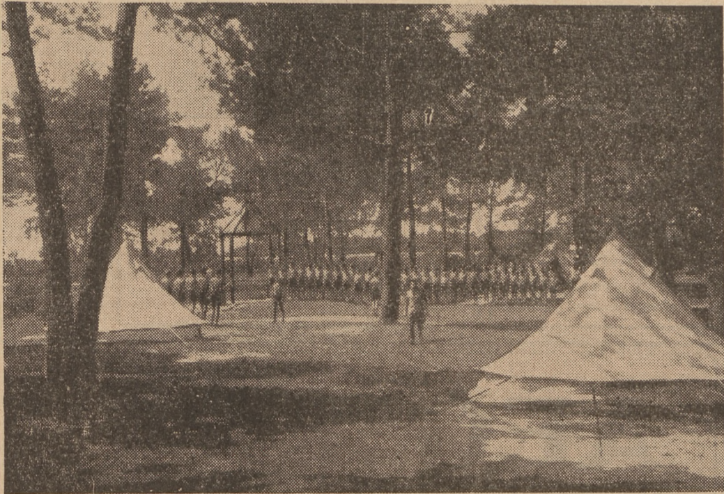
Schnell sind die Jungen zum Empfang der Gäste in der Zeltstadt der HJ am Swider angetreten

zum Schwimmsport, marsch marsch! Im Nu ist alles unten am sandigen Strand versammelt. Wie eine wilde Meute warten Pimpfe und Hitlerjungen auf das Signal zum Sprung ins Wasser. Und dann toben 180 Jungen in den Swider, stürzen sich kopfüber in das nasse Element, daß das Wasser wild schäumt und gurgelt, tauchen unter und halten dann wieder eine kleine Ruhepause im heißen Sand. Das gibt richtig Kohldampf, und für die hungrigen Mägen stehen bei der Lagerküche zwei Gulaschkanonen. Eine trägt vorne