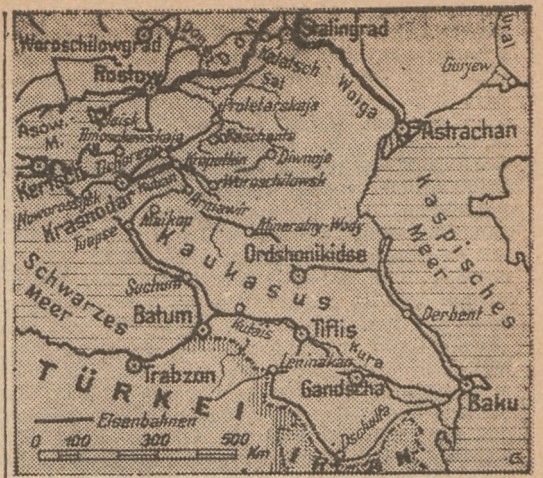
Karte des Kaukasusgebiets

Die Erschließung des Kaukasus durch Verkehrswege ist durch die Großartigkeit der Bergnatur wesentlich erschwert. Im Norden umfährt die Bahn von Noworossijsk nach Baku das Gebirgsmassiv, und am Südrande führt eine Bahn von Batum über Tiflis nach Baku. Das Gebirge selbst wird nicht von Bahnlinien durchschnitten. Der Verkehr geht über eine Reihe von Querpässen, deren wichtigste folgende sind: in 2345 Meter Höhe der Kreuz- oder Darielpaß, über den die grusinische, der Mamisonpaß (2816 m), über den die ostetische, und der Kluchorapaß (2767 m), über den die Suchumsche Bergstraße führt. Im Winter ist nur der Kreuz- oder Darielpaß passierbar. Bekannt ist, daß die Förderung des Baku-Ölgebiets durch die große, am Fuße des Kaukasus entlang gelegte Oldruckleitung nach Batum gepumpt wird, von wo die Verteilung entweder durch ein weiteres, nach Norden gehendes Röhrensystem, durch Schiff oder Schiene erfolgt. Batum ist ne-