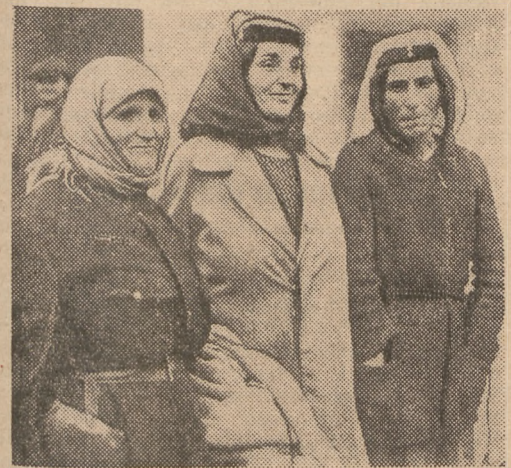
Georgische Frauen, die von den Bolschewisten zum Milizdienst gezwungen wurden

Durch das Erreichen des Kaukasus auf vielhundert Kilometer breiter Front, insbesondere mit der Eroberung Maikops und des in diesem Raum liegenden wichtigen Ölgebietes, hat die