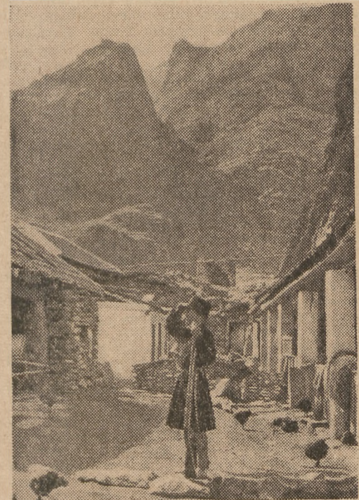
Gewaltig ist die Gebirgswelt des Kaukasus. Blick in ein Tungusendorf