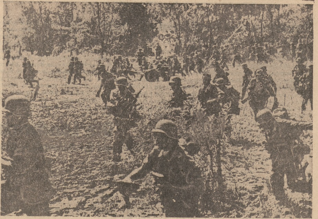
Infanterie bei tropischer Hitze während eines Stellungswechsels im Gebiet des Don.