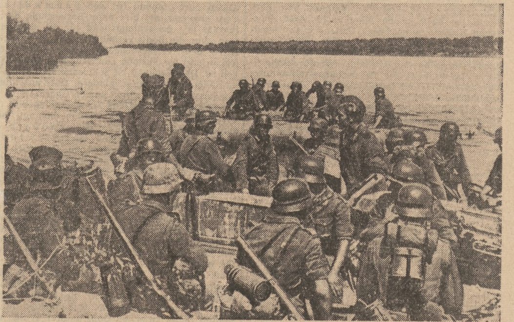
Bei der Verfolgung des weichenden Gegners wird der Don mit Sturmbooten bezwungen.