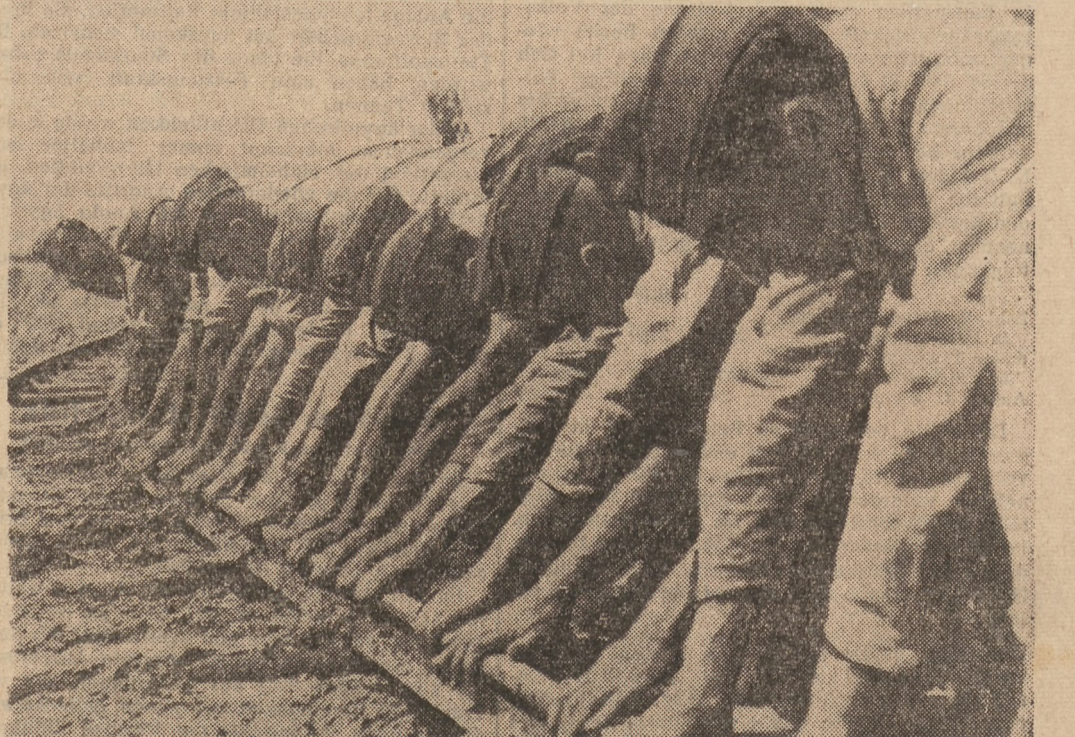
Eine Startbahn entsteht: Viele kräftige Hände fassen zugleich an, um die Schienen einer Feldbahn zu verlegen.