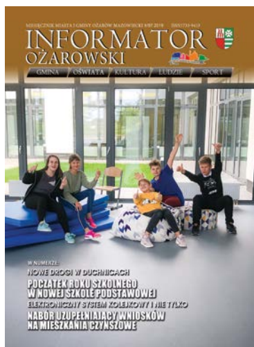
Okładka: Nowy budynek Szkoły Podstawowej Nr 2 w Ożarowie Mazowieckim