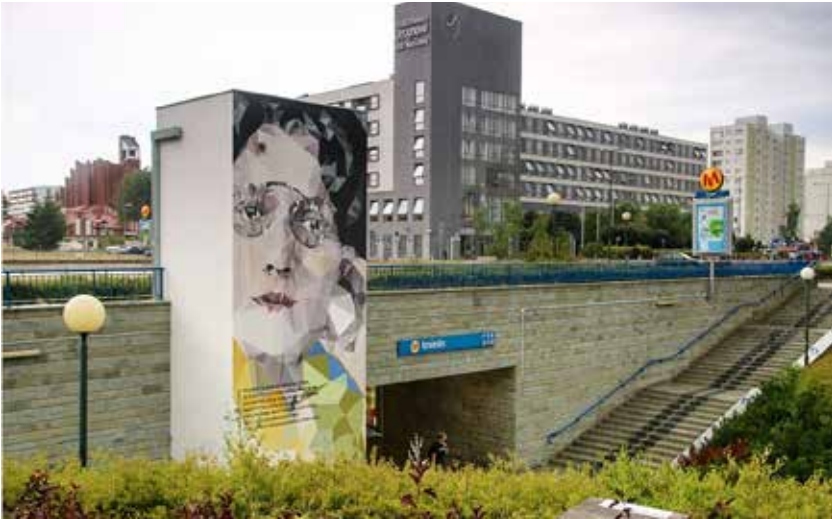
Mural Marii Grzegorzewskiej.