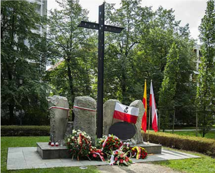
Pomnik Zgrupowania „Chrobry I”, 31 sierpnia

Informacje o uroczystościach w miejscach pamięci w Warszawie we wrześniu i październiku, informacje o uroczystościach poza Warszawą oraz omówienie imprez kulturalnych i sportowych związanych z obchodami 74. rocznicy Powstania zamieścimy w następnym numerze biuletynu.