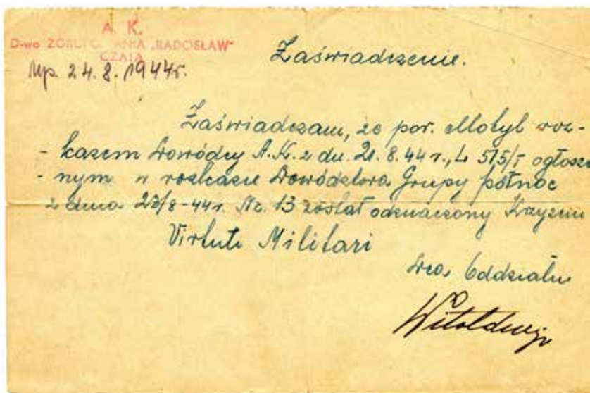
Zaświadczenie o nadaniu Virtuti Militari podpisane przez mjr. Tadeusza Runge

dorskim Orderu Odrodzenia Polski, Krzyżem Oficerskim Orderu Odrodzenia Polski, Krzyżem Walecznych (dwukrotnie), Krzyżem Partyzanckim, Krzyżem Armii Krajowej, Warszawskim Krzyżem Powstańczym, Odznaką za Rany i Kontuzje (trzykrotnie ranny), Medalem za Warszawę 1939-1945, Medalem Pro Memoria, Medalem Pro Patria, Brązowym Medalem Za Zasługi dla Obronności Kraju i Medalem Izraelskich Sił Obronnych. Otrzymał także Odznakę Mechanika Lotniczego, Odznakę „Za zasługi w upamiętnianiu bohaterstwa Żołnierzy Batalionów Chłopskich”, Medal „Za zasługi dla Fundacji Warszawa Walczy 1939-1945”, Medal Pamiątkowy Pro Masovia, Medal z okazji 70. rocznicy Powstania Warszawskiego oraz Medal Augusta Ferdynanda Wolffa – najwyższe odznaczenie Towarzystwa Lekarskiego Warszawskiego. Od 31 lipca 2008 r. był Honorowym Obywatel m. st. Warszawy. (opr. MB)