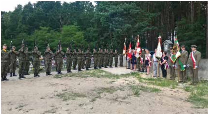
Łaskarzew, 11 lipca 2018 r.