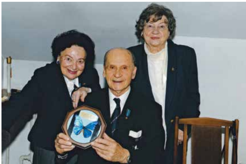
Zbigniew Ścibor-Rylski z redaktorami biuletynu ZPW: Jolantą Kolczyńską (po lewej) i Apolonią (Polą) Kowalską

Po tym, jak upomniął na Kopcu Powstania Warszawskiego w roku 2012 skandujących „raz sierpem, raz młotem czerwona hołotę”, zaczęto szperać w Jego papierach w IPN, zaczęto Jego lustrację. Praktycznie aż do końca życia Generała procesu nie dokończono, a nawet w marcu 2018 r. zaczęto go kontynuować. Generał z godnością to wszystko znosił, mimo że zamiast wdzięczności za czyny podczas II wojny światowej i Powstania