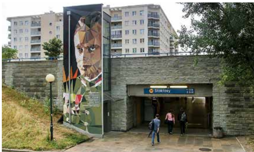
Mural Witolda Pileckiego

W czasie okupacji Maria Grzegorzewska od 1940 r. była referentką działu kształcenia nauczycieli Delegatury Rządu. W latach 1942/1943 i 1943/1944 prowadziła roczne tajne studium przygotowujące nauczycieli do zakładów kształcenia nauczycieli. Wysyłała też materiały samokształceniowe nauczycielom przebywającym w obozach jenieckich. Dla Komendy Głównej AK prowadziła pracownię badającą i kwalifikującą kandydatów do pracy konspiracyjnej. Należała do Głównego Komitetu Pomocy Żydom. Była też wykładownicą tajnego Instytutu Pedagogicznego ZNP oraz