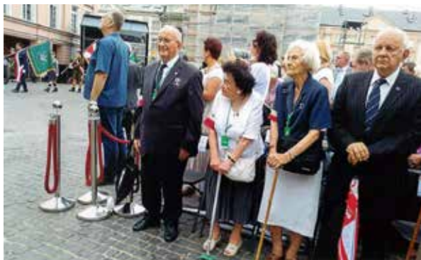
Plac Krasińskich

Na koniec pragnę wszystkim Powstańcom podziękować za wspólne obchody kolejnych rocznic Powstania. Przez ostatnich 12 lat to było dla mnie zawsze wielkie przeżycie i zaszczyt.