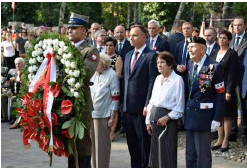
Uroczystość przy pomniku Gloria Victis

żołnierzy poległych w Powstaniu Warszawskim, cmentarz przy ul. Łagiewnickiej, następnie mogiły pomordowanych w Lesie Kabacim: na przedłużeniu ul. Moczydłowskiej oraz na przedłużeniu ul. Rybałtów