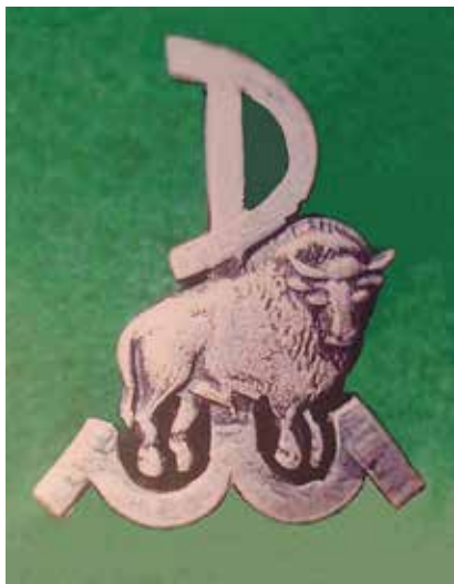
Odznaka Zgrupowania AK „Żubr”

miejscu. Oddział maszynistów miał przedrzeć się do Śródmieścia. Później dowiedziałam się, że zostali na Żoliborzu.