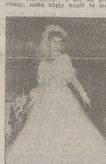
Najpiękniejsza suknia ślubna z kolekcji „Biała Dama”.

jedwabiu, o oryginalnych tancerzach i modnych kolekcjach. Najpiękniejsze pokazemy w kolejnych „Kasiach” a kto się pocięży, może zająć kupić te mo-