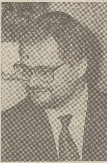
„NASZE KONTAKTY Z EWG TO NIE JEST STOSUNEK MIŁOSNY”