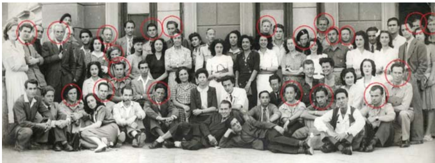
Polacy w Akademii Sztuk Pięknych w Rzymie, zaznaczeni w kółeczkach, Rzym 1946