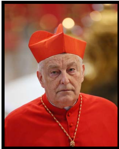
Ks. kard. Zenon Grocholewski

Kiedy wczesnym rankiem lub późnym popołudniem ulicami rzymskiej dzielnicy Capenelle zmierzał w kierunku domu dla starców San Giuseppe skromnie ubrany ksiądz, któremu przechodnie kłaniali się z szacunkiem, niewielu z nich wiedziało, że mijał ich wielki Polak, jeden z największych umysłów naukowych w dziedzinie prawa, wybitny hierarcha Kościoła – Zenon kardynał Grocholewski, którego motto życiowe brzmiało: Sprawiedliwość to jeszcze nie wszystko. Jesteśmy bowiem powołani do czegoś więcej, do realizowania miłości: to jest pierwsze i największe przykazanie. Należy jednak uważać, że nie może być mowy o realizowaniu miłości bez sprawiedliwości.