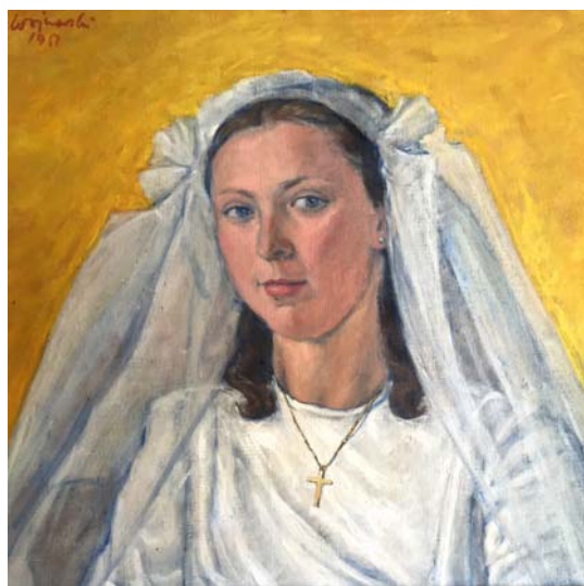
Tadeusz Wojnarski, Portret żony , 1951, wł. pryw., fot. JWS