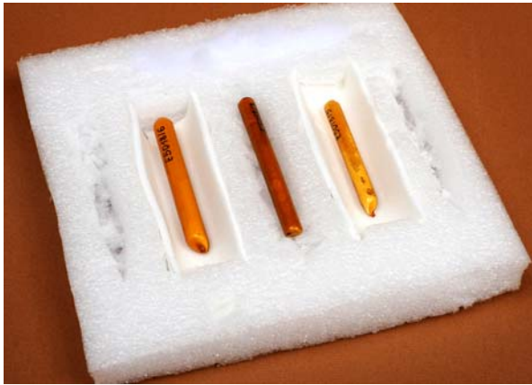
Zapalniki do butelek z benzyną ze zbiorów Muzeum Niepodległości w Warszawie, sygnatura MN E5018/1-6

Podczas II wojny światowej skuteczny opór wobec niemieckiego okupanta wymagał użycia broni i amunicji, a dostęp do niej był w dużym stopniu ograniczony. Organizacje konspiracyjne starały się uzupełniać braki w uzbrojeniu, m.in. wytwarzając je we własnym zakresie. Jedną z takich broni były butelki zapalające.