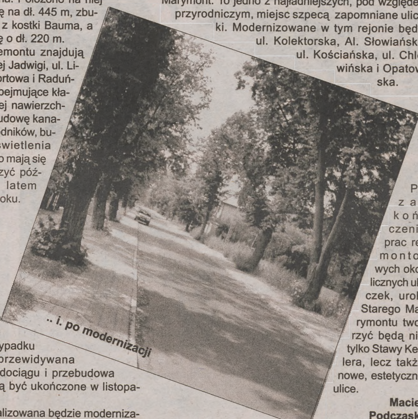
... i. po modernizacji

W przypadku ul. Raduńskiej przewidywana jest również budowa wodociągu i przebudowa gazociągu. Prace te mają być ukończone w listopadzie br.