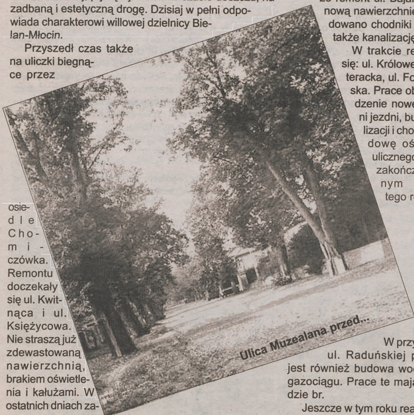
Ulica Muzealana przed...

Przyszły rok niewątpliwie ucieszy mieszkańców Młocin, Wrzeciona i Marymontu. Plany na 2004 r. obejmują modernizację ulic: Wygon, Brązowniczej, Abecadło, Lindego, Nocznickiego (na odcinku Pstrowskiego - Parola), Grochowiaka. Przebudowane zostanie skrzyżowanie ulic Kwitnącej z Nerudy, a także przewiduje się wykonanie ciągu pieszo-jezdnego w rejonie ulic Przy Agorze i Wrzeciono. Prace remontowe obejmą również Stary Marymont. To jedno z najładniejszych, pod względem przyrodniczym, miejsc szpecą zapomniane uliczki. Modernizowane w tym rejonie będą: ul. Kolektorska, Al. Słowiańska, ul. Kościańska, ul. Chlewińska i Opatowska.