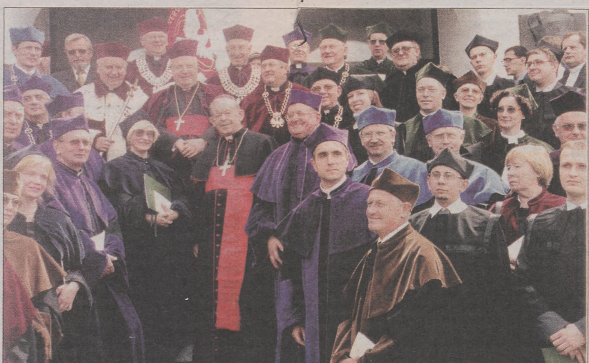
Pamiętkowe zdjęcie z Senatem Uczelni