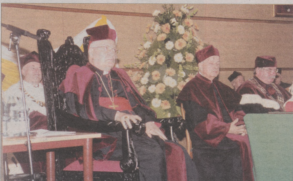
Kard. A. Sodano słucha kolejnych mówców

Dowiedział się o tym szef dyplomacji watykańskiej kard. ANGELO SODANO