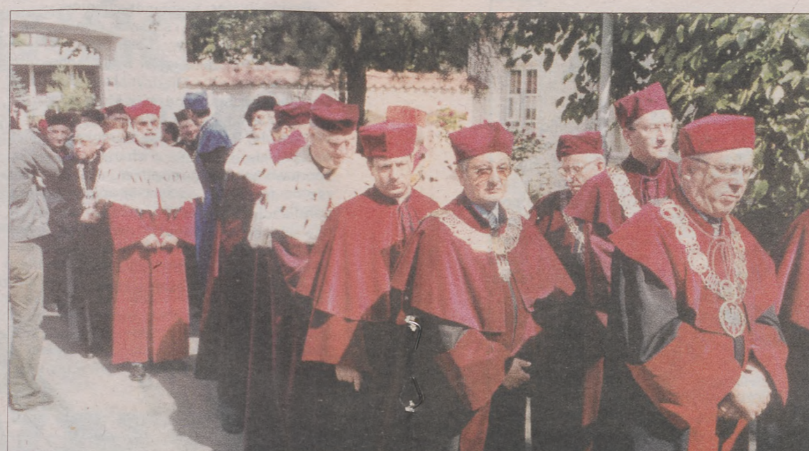
Licznie przybyli na tę uroczystość przedstawiciele władz wyższych uczelni z całej Polski