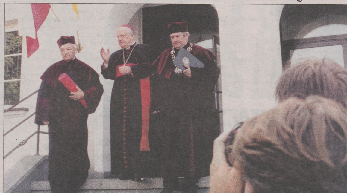
A. Sodano wychodzi z budynku Rektoratu na uroczystość