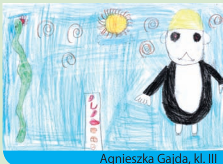
Agnieszka Gajda, kl. III