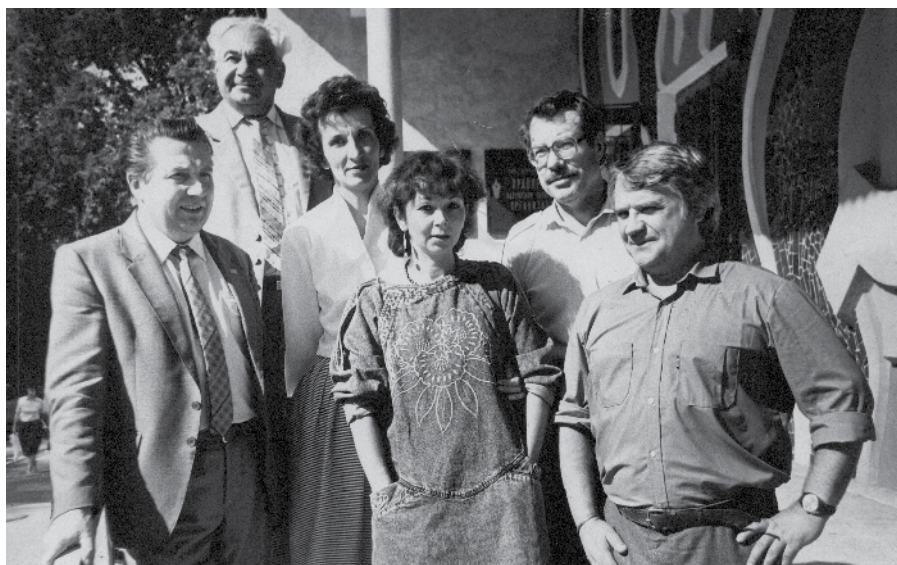
1988 rok. Kaługa. Autorka tekstu (w środku) rosyjskimi dziennikarzami. Obok, pierwszy od lewej redaktor naczelny kałużskiej gazety, zastrzelony niedługo potem w redakcji.

Pracował wtedy w Warszawie. Rok później 30 sierpnia, zmarł na zawał wracając autobusem z Warszawy do Ostrołęki. W nowej redakcji były znacznie lepsze warunki w porównaniu do ciasnoty w dotychczasowej siedzibie. Rozrosło się biuro ogłoszeń, księgowość. Bo i gazeta się pomyślnie rozrastała.