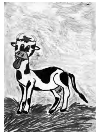
rys. Ewelina Wielgo

Spis zwierząt należy dostarczyć do kierownika Biura Powiatowego Agencji Restrukturyzacji i Modernizacji Rolnictwa osobiście, za pośrednictwem poczty lub z wykorzystaniem platformy cyfrowej e-PUAP najpóźniej 7 dni od dnia jego przeprowadzenia.