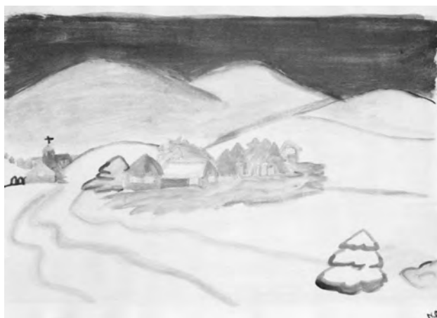
rys. Natalia Barszczewska kl. IIIa