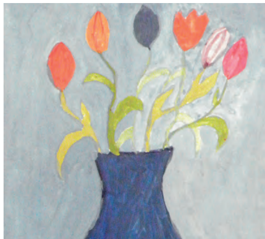
rys. Mrozowska Ilona kl. 1c