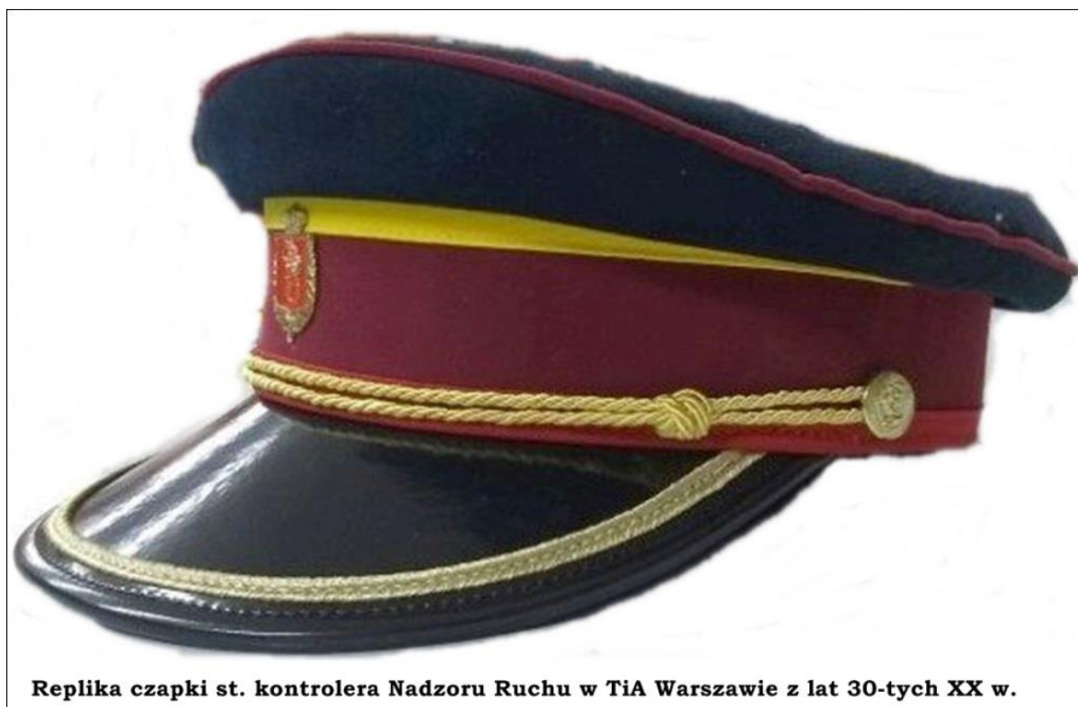
Replika czapki st. kontrolera Nadzoru Ruchu w TiA Warszawie z lat 30-tych XX w.

Po upływie pięciu lat nienagannej służby w Tramwajach i Autobusach m. st. W-wy, a wymagało to wielu wyrzeczeń, kontroler otrzymywał od kierownictwa firmy nie tylko finansowy awans, ale i pozwolenie na przełożenie sznura wokół Syrenki. Dla pracowników ruchu, konduktorów, motorniczych, kierowców posiadacz takiej czapki był już szanowanym fachowcem, znającym na pamięć wszelkie regulaminy, przepisy niemal na wrywki. Szczególnie dla młodych stażem był swego rodzaju autorytetem, z którym nie dyskutuje się i wykonuje polecenia.