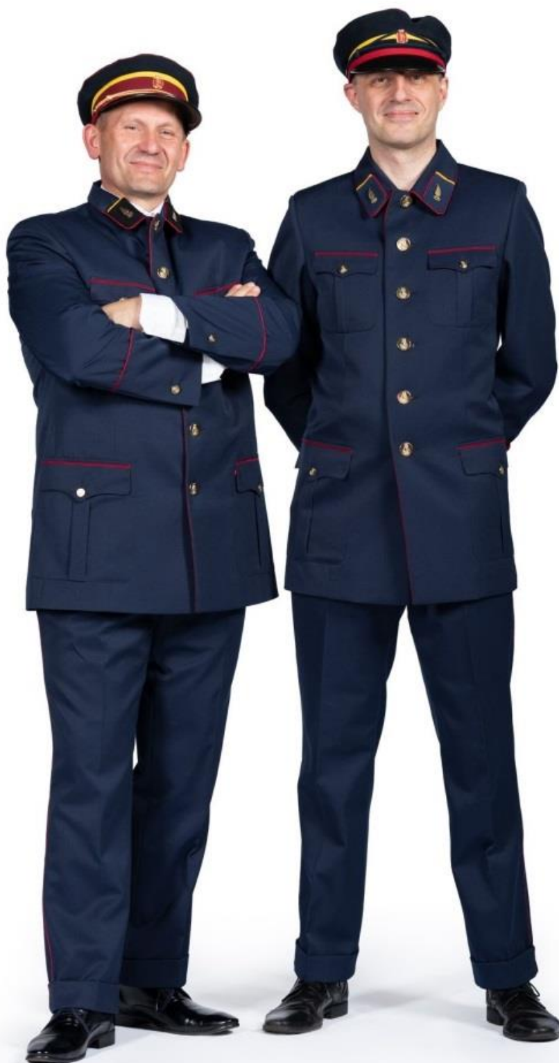
Repliki mundurów pracowników TiA m. st. W-wy z lat 30-tych XX

Nowy wzór nakrycia (wz. 1935), który otrzymali w pierwszej kolejności kierowcy, sukcesywnie miał być wprowadzany dla pozostałych pracowników – motorniczych, konduktorów i częściowo zaplecza technicznego, głównie