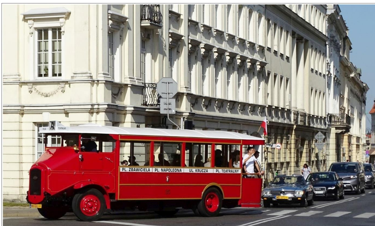
Rewitalizacja autobusu Somua - czerwiec 2020 r, foto Bartek/trasbus.com

Zaiste, widok owych młodych pań może pobudzić wiele zmysłów, nawet tych głęboko uśpionych w głowach, co poniektórych bogobojnych, ale żeby autobus? Trudno w nim doszukać się kobiecych kształtów. Prędzej męskich, patrząc choćby na przednią osłonę silnika, ale być może w okresie międzywojennym inne było postrzeganie kobiecych wdzięków.