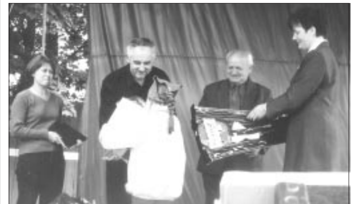
Państwo Chelchowsky i władze miasta wręczają dzieciom ufundowane nagrody.