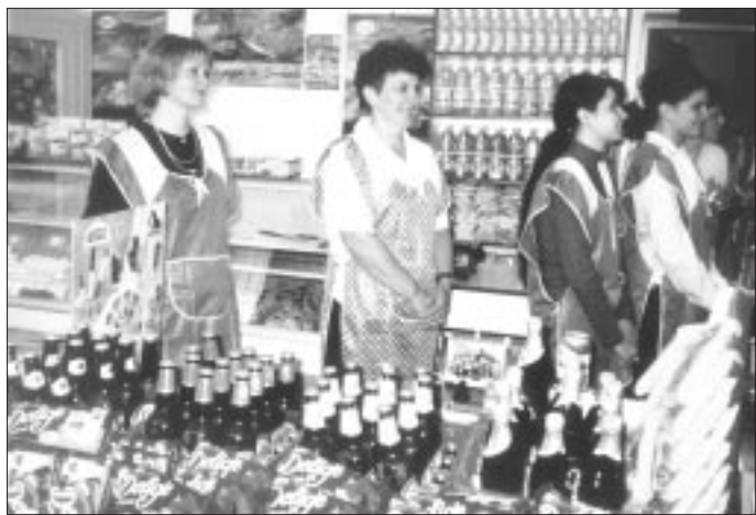
■Personel nowo otwartego sklepu.