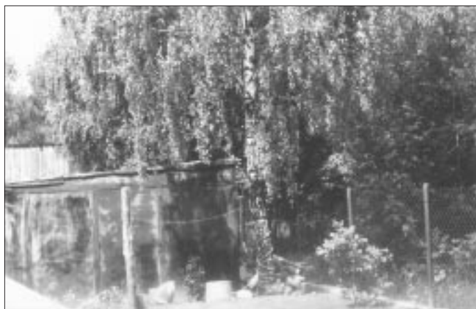
■ Brzoza, na której wisiało bezwładne ciało Yuriya. Na ziemi leżą jeszcze zwoje liny, na której zawisł.