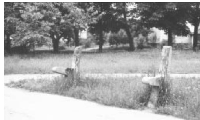
■ To jest ławka na przystanku autobusowym przy Al. Niepodległości.

W gestii Wydziału jest nie tylko budowanie i tworzenie, ale również naprawianie tego, co zniszczyli wandalci. Sto dwadzieścia dwie tablice z nazwami ulic i pla-