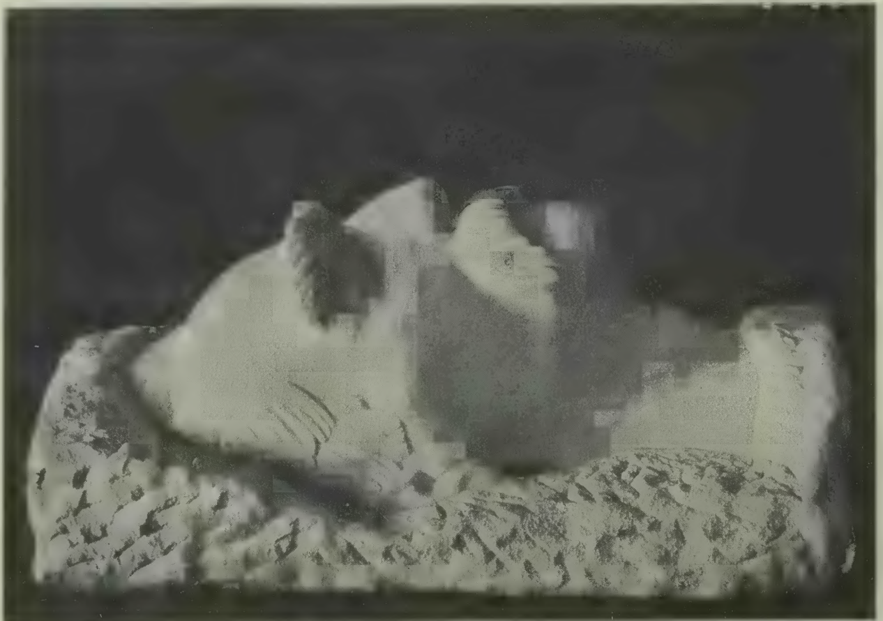
Rzeźba kol. Stanisława Rzeckiego