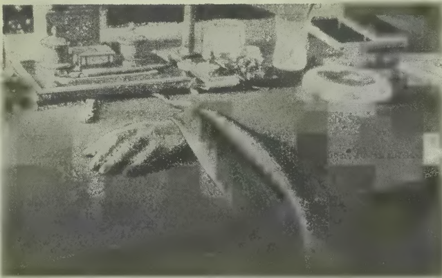
Odlew ręki Komendanta

wistości. Do Belwederu bowiem, jak do świątyni, w której króluje Wielki Duch Wodza Narodu, ciągną pielgrzymki ze wszystkich zakątków Polski, by tu u tego przezycystego źródła mocy i wielkości zaczerpnąć pokrzepienia i otuchy dla dalszego zmagania się z przeciwnościami losu. Przychodzą tu mali i wielcy, dzieci i starcy, swoi i obcy; chłop, robotnik, inteligent, żołnierz czy dygnitarz, — by hołd złożyć Wielkiemu Ojcu Ojczyzny.