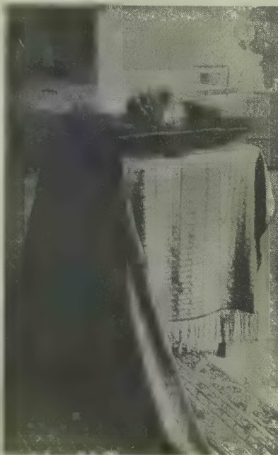
Maska pośmiertna Komendanta