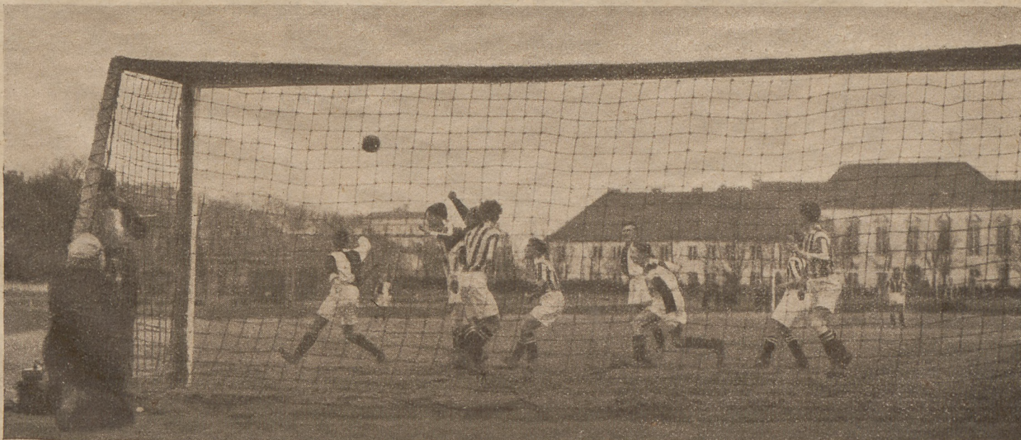
Rzut z rogu pod bramką Varsovii, w spotkaniu jej z Warszawianką (0:1).

Mistrzostwa klasy „B”. Spotkały się w nich dwie godne rywalki: Makkabi, trenowana przez Ferencza, i Skra, mająca za sobą całą zimę przygotowań oraz długi szereg zaszczytnych wyników. Okazało się, że narazie żadna z drużyn przewagi swej zaznaczyć nie może. Rezultat meczu brzmiał 2:2, aczkolwiek mógł być lepszy dla Skry, która nie wyzyskała rzutu karnego. Sędziował p. T. Walczak. Groźny w Warszawie Ruch doznał pewnej porażki 2:0 w Radomiu od RKS.