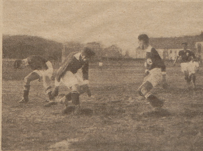
W poszukiwaniu piłki.