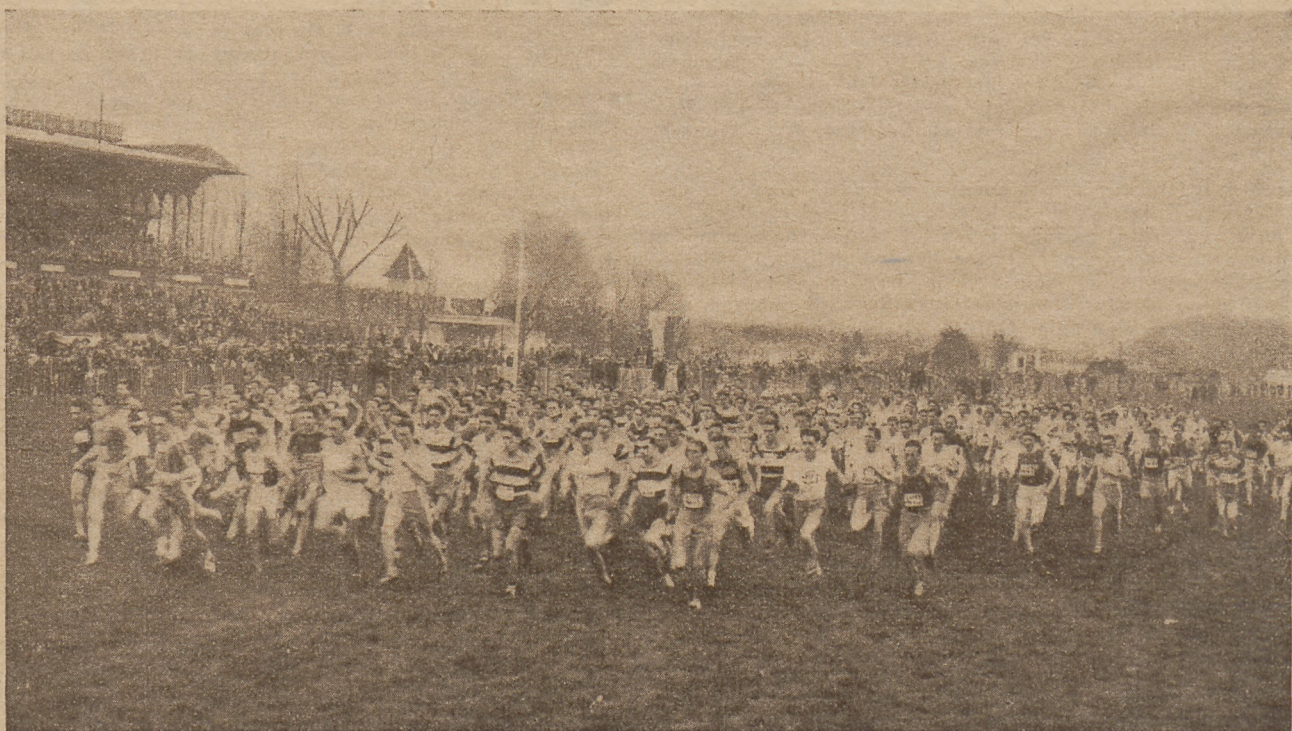
W francuskim narodowym biegu na przełaj (12 klm.) startowało „tylko“ 290 najlepszych dystansowców.

Pierwsza połowa biegu nie przynosi, mimo oczekiwań, żadnych emocji; wszyscy zawodnicy, a startujących