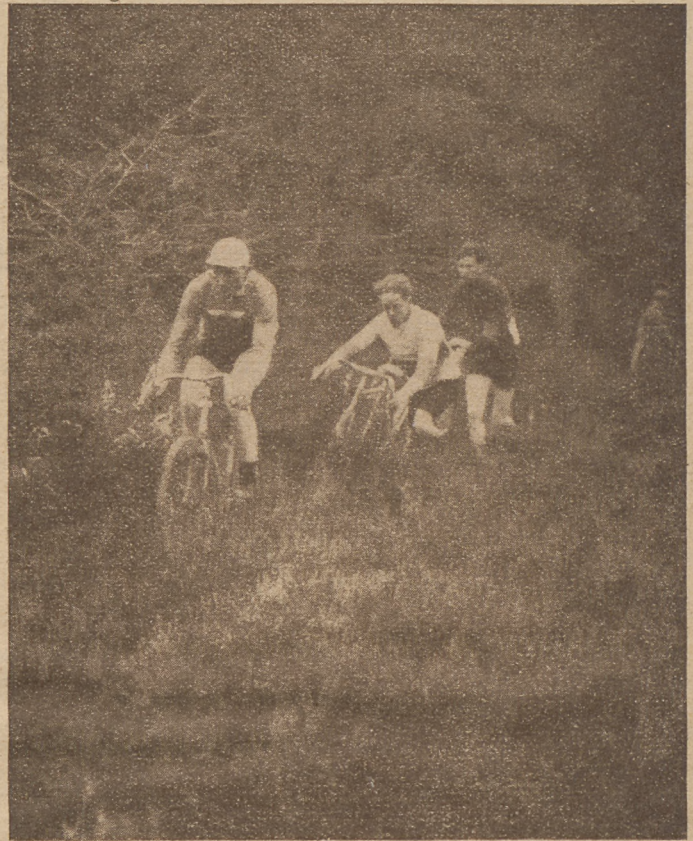
Trasa cyklopedestre'u o mistrzostwo Francji prowadziła przez nader malownicze odcinki.