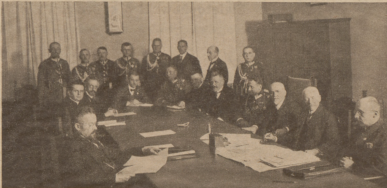
Pierwsze plenarne posiedzenie Rady Naczelnej Wych. Fiz. i Przysp. Wojsk. odbyło się w Warszawie dn. 28 marca r. b.