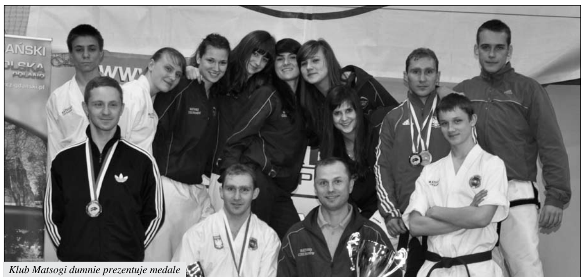
Klub Matsogi dumnie prezentuje medale