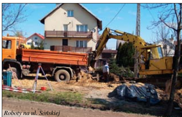
Roboty na ul. Sońskiej