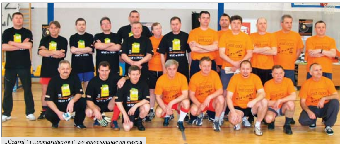
„Czarni” i „pomarańczowi” po emocjonującym meczu

zwycięzcami są korzystający z zasobów naszego Banku, bo biletem wstępu na mecz były jajka oraz inna żywność. Zebrano jej ok. 1500 kg. Piłkarskie spotkanie „na szczycie” odbyło się zamiast zbiórki żywności w sklepach przed Wielkanocą. – Nie było problemu z zainteresowaniem szacownych zawodników celem akcji i misją Banku Żywności. Zaangażowanie się w to wydarzenie sportowo-charytatywne zaowocuje być może innymi formami współpracy z naszą fundacją – ma nadzieję Dorota Jezierska. red.