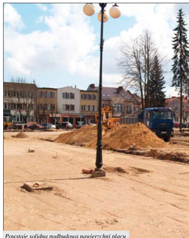
Powstaje solidna podbudowa nawierzchni placu

Pierwszego dnia wiosny na parking przed Urzędem Stanu Cytel II stanęły ciężkie maszyny PRASBETU – firmy, która wygrała przetarg na wykonanie prac. Sprawdzone już jako sprawny i solidny wykonawca deptaku na ul. Warszawskiej, firma PRASBETU przystąpiła do mocnej podbudowy pod nawierzchnię placu z granitowej kostki, płyt i rozbiórkowych. Usunięto stare krawężniki na obrzeżach parku, korony drzew. Zdemontowana została także betonowa fontanna pamiętająca o wczesnym, sterowanym wodotrysku wyrzucającym w górę strumienie wody. W części podłoża wykonawca wybudował już większość sieci kanalizacyjnej. W tym celu prace przebiegają szybko. Zakończenie inwestycji w tym zakresie w tym roku jest możliwe. Wzrost kosztów rewitalizacji placu (budowy odwodnienia, nawierzchni i oświetlenia) wyniesie ok. 8 mln zł. Plac przed ratuszem wypięknieje. Nie powstydzimy się, jeśli prace te będą z zewnątrz. Będzie jednak pełnił jeszcze inną, nie mniej ważną funkcję – przyczyniając się do budowania więzi społecznych, miejscem odpoczynku i rekreacji przy wolnym powietrzu.