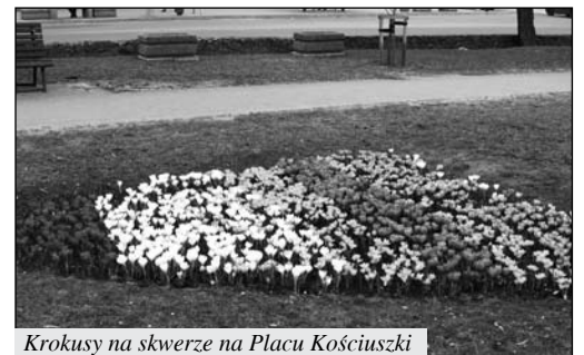
Krokusy na skwerze na Placu Kościuszki

Wiosenna pogoda sprzyja porządkowaniu miasta. Oddział Zieleni Miejskiej na zlecenie Urzędu Miasta przycina drzewa i krzewy w pasach dróg oraz na miejskich placach i skwerach. Wyrównuje się alejki w parkach, a drzewka i krzewy zasilane są nawozami. Zamieciono ponad 45 km miejskich dróg. Nie wszystkie miejsca udaje się sprzątnąć przy pomocy urządzeń mechanicznych. Ręcznym sprzętaniem zajmuje się ok. 20 osób, w ramach robót publicznych, społecznie użytecznych oraz skierowanych przez sąd. Do ich obowiązków należy zbieranie śmieci, oczyszczanie chodników, zatok postojowych i parkingów. Podczas wiosennych porządków do tej pory zebrano blisko 650 worków śmieci.