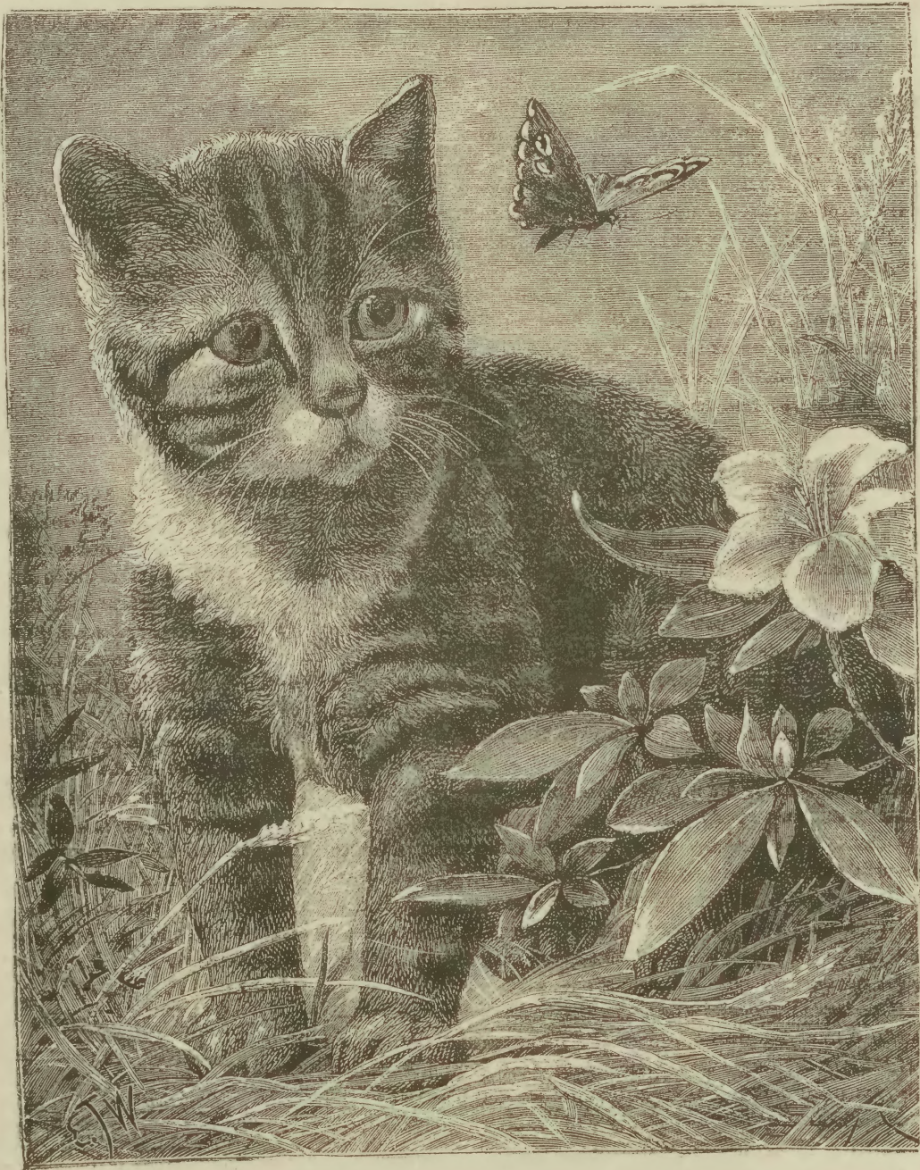
Do kotka (str. 163).

Katarzyny, natomiast gorliwie zabrałem się do ciotuni, a ponieważ poczciwa p. Gudula, nie będąc gadatliwą w ujemnem znaczeniu tego wyrazu, do milczących także nie należy, więc pomalutku z jej rozmowy doszedłem wszystkiego. Inny autor, dla wywołania dramatycznych wrażeń, trzymałby może