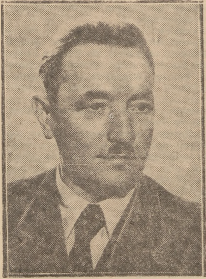
W dn. 24 bm. o godz. 19 Prezydent K. R. N. Stanisław Bierut wygłosił przez Radio do wszystkich Polaków przemówienie wigilijne.

w oparciu o nasz wspólny trud Przemówienie wigilijne Prezydenta Bieruta