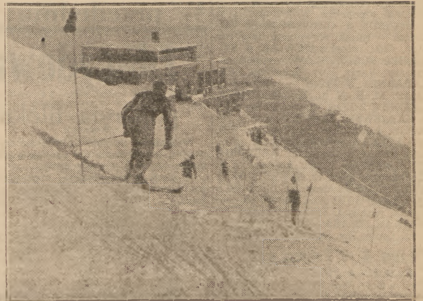
Wczasy świąteczne w Zakopanem.